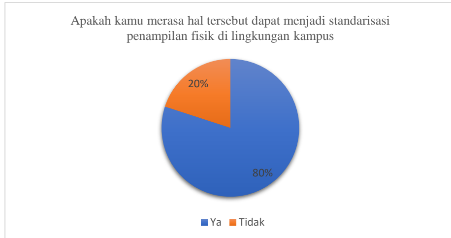
Gambar 1.4 Diagram Pra Riset III

Hasil riset menunjukkan sebanyak 77% mahasiswi Telkom University mengatakan iya dimana perbedaan tersebut menimbulkan gap dan juga pandangan mahasiswi antar fakultas dalam mempersepsi citra tubuhnya dan sisanya tidak mengatakan adanya perbedaan akan hal itu.