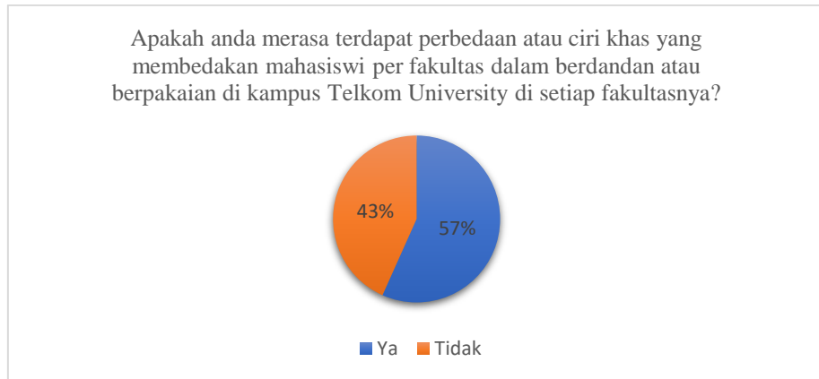
Gambar 1.2 Diagram Pra Riset I