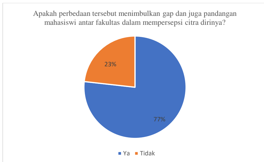
Gambar 1.3 Diagram Pra Riset II

Para mahasiswi di lingkungan Telkom University sebanyak 57% merasa terdapat perbedaan atau ciri khas yang membedakan mahasiswi per fakultas dalam hal berdandan atau berpakaian di kampus Telkom University di setiap fakultasnya dan sisanya sebanyak 43% tidak merasa terdapat perbedaan atau ciri khas yang membedakan mahasiswi per fakultas dalam hal berdandan atau berpakaian di kampus Telkom University di setiap fakultasnya.