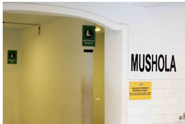
Gambar 1. 10 Mushola