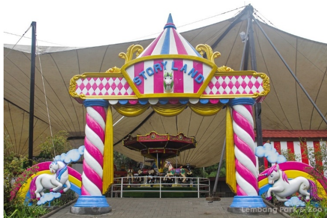
Gambar 1. 6 Story Land

Sebagai tempat bermain, tentunya Lembang Park & Zoo menyediakan arena permainan untuk anak-anak. Mulai dari playground , kereta mini, storyland dengan berbagai wahana seru, dan sekolah riding khusus anak. Pengunjung juga bisa melakukan aktivitas lainnya seperti Feeding Time atau memberi makanan untuk satwa seperti harimau Siberian, harimau Bengal, Singa Putih, gajah Sumatra, kuda poni, burung unta, dan beberapa satwa lainnya.