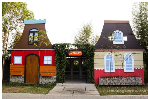
Gambar 1. 11 Toilet