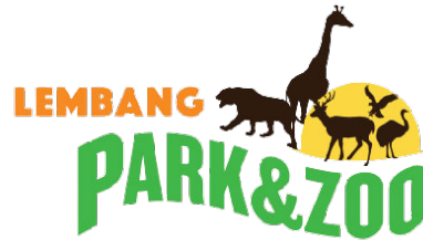
Gambar 1. 1 Logo Lembang Park & Zoo