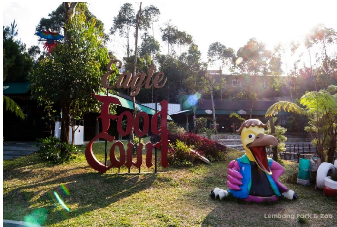
Gambar 1. 5 Eagle Food Court

Konsep tempat makan Eagle Food Court dibuat seperti kantin, dengan menyediakan beberapa menu mulai dari cemilan hingga makanan berat. Posisi tempatnya berbeda dengan restoran Mari Makan dan Tiger Resto. Eagle Food Court berada di belakang. Harga yang ditawarkan juga relative lebih murah dari resto-resto yang sudah dijelaskan sebelumnya.