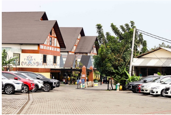
Gambar 1. 12 Zona Parkir