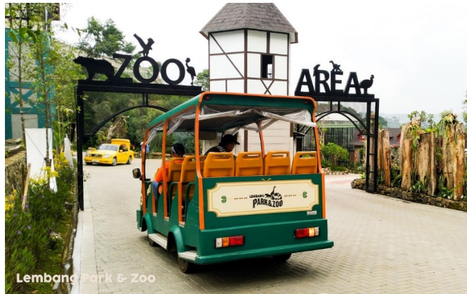
Gambar 1. 13 Wara -Wiri