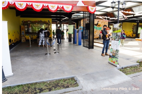
Gambar 1. 9 Jalur Disabilitas