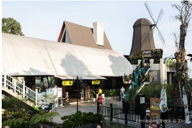
Gambar 1. 4 Tiger Resto