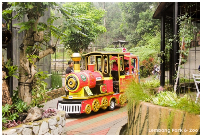
Gambar 1. 7 Kereta Mini