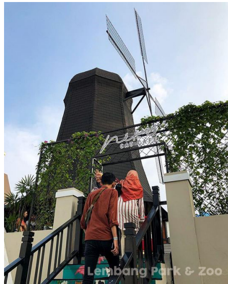
Gambar 1. 3 Neko Cat Café

Café yang cocok untuk pecinta kucing. Terdapat puluhan kucing dari berbagai ras, semua kucing berkeliaran di dalam ruangan yang bisa di ajak bermain oleh pengunjung. Sebelum masuk, pengunjung akan diminta untuk cuci tangan dan menggunakan hand sanitizer serta mengganti alas kaki dengan sandal ruangan, hal ini bertujuan untuk menjaga kesehatan dan kebersihan kucing-kucing disana. Pengunjung dikenakan tarif Rp. 30.000 di hari biasa dan Rp. 40.000 di hari libur untuk masuk ke dalam Neko Cat Café.