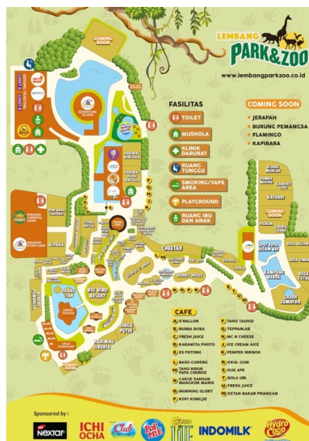
Gambar 1. 2 Visitor Map

Luasnya Lembang Park & Zoo tentunya akan membingungkan pengunjung yang datang, oleh karena itu Lembang Park & Zoo menyediakan visitor map untuk para pengunjung.