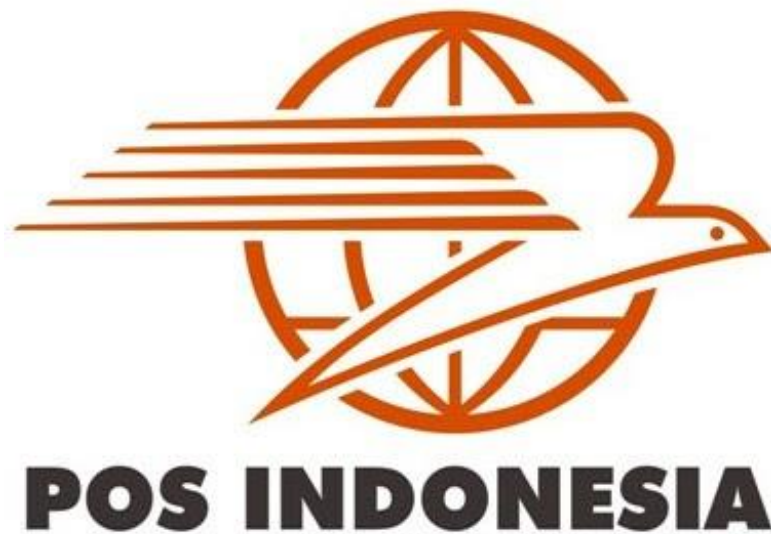
Gambar 1. 1 Logo PT. Pos Indonesia