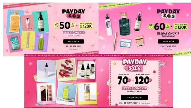
Gambar 1. 2 Konten Pemasaran Program Payday S.O.S

Sociolla juga menjadi satu dari sekian e-Commerce yang memanfaatkan strategi komunikasi pemasaran melalui media sosial Instagram, dengan aktif melakukan kegiatan pemasaran melalui fitur feeds dan story pada media sosial Instagram. Melalui media sosial Instagramnya Sociolla juga kerap memberikan informasi mengenai produk yang tersedia selain mengkomunikasikan mengenai produk yang dipasarkan Sociolla juga kerap memberikan konten menarik serta informatif yang berkaitan dengan kecantikan baik mengenai skincare ataupun beautycare . Media sosial Instagram dari Sociolla juga kerap memiliki program yang beragam salah satunya Program Payday S.O.S dari Sociolla yang hampir setiap bulannya dilaksanakan untuk mengajak konsumen untuk melakukan pembelian dengan potongan-potongan khusus pada tanggal tertentu yaitu tanggal payday atau pada tanggal-tanggal hari gajian.