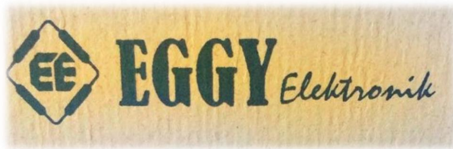
Gambar 1. 1 Logo Eggy Elektronik