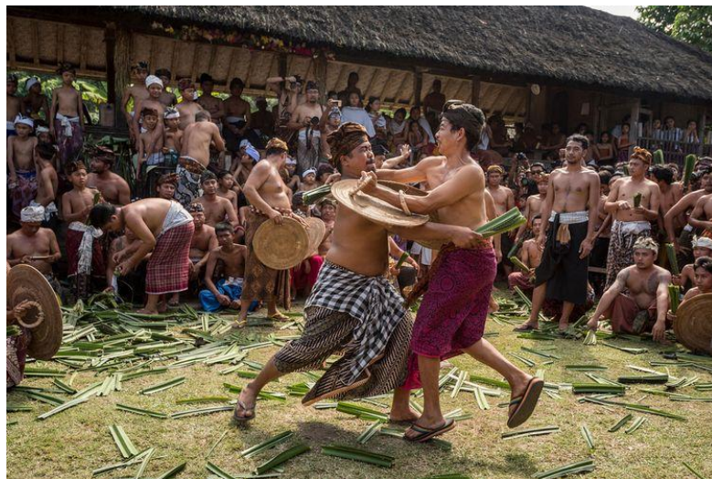
Gambar 1.3 Tradisi Perang Pandan

Tradisi ini dilakukan dengan cara bertarung satu sama lain dengan membawa senjata berupa daun pandan berduri dan juga tameng sebagai perlindungan. Peserta tradisi mekare-kare ini akan saling bergulat untuk melukai lawannya sampai berdarah. Tradisi ini sesungguhnya berkaitan dengan upacara keagamaan di desa ini yakni ngusaba sambah yang salah satu rangkaianannya adalah mekare-kare sebagai upacara korban atau disebut sebagai tabuh rah . Masyarakat Tenganan percaya bahwa darah yang mengalir dari tubuh penari merupakan simbol persembahan suci kepada Dewa Indra (Dewa Perang) (Darmana, 2017).