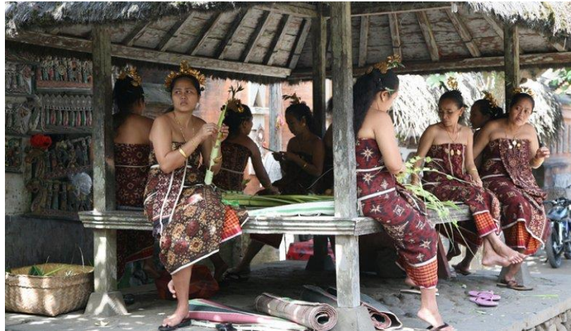
Gambar 1.1 Masyarakat Desa Tenganan Menggunakan Kain Gringsing