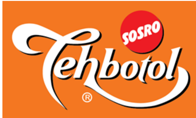
Gambar 1. 1 Logo Perusahaan