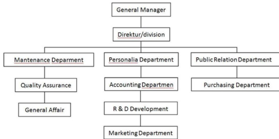
Gambar 1. 2 Struktur Organisasi