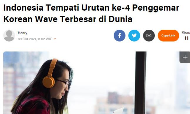
Gambar 1.1 Popularitas Korean Wave di Indonesia

Korea Selatan merupakan salah satu negara yang berada di Asia. Terdapat banyak budaya yang ada di Korea Selatan. Sejak tahun 1990-an Korea Selatan muncul sebagai pusat baru untuk produksi budaya populer transnasional (Kim et al, 2019). Korea selatan mengeksport budayanya ke berbagai Negara Asia termasuk Jepang, Cina, Taiwan, Hongkong, Singapura termasuk Indonesi (Kim et al, 2019). Penyebaran budaya populer Korea Selatan dikenal dengan istilah “ Korean Wave ” atau “ Hallyu ”. Korean Wave menyangkut cukup banyak hal seperti Korean Fashion , Korean Film , Korean Drama , Korean Food , Korean Language , Korean Skincare dan Korean Pop (K-Pop) (Wicaksono, 2021).