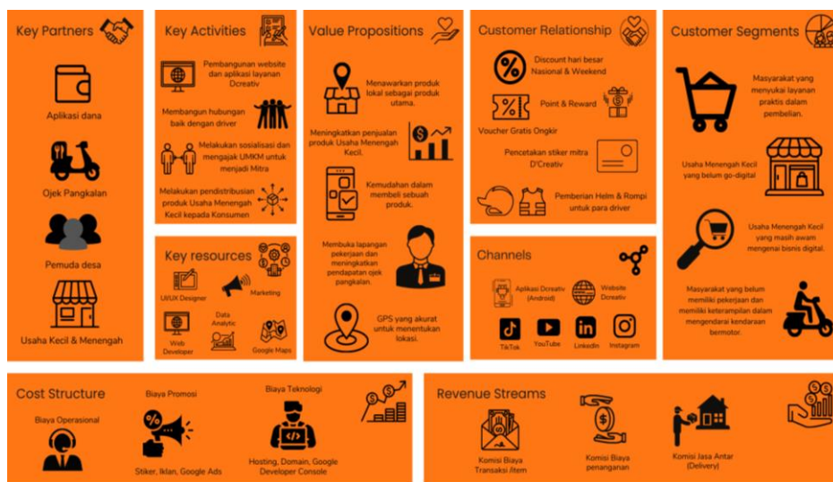
Gambar 1. 1 Business Model Canvas

Adapun Business Model Canvas yang digunakan oleh D’Creativ Indonesia dapat dilihat pada Gambar 1 berikut ini.