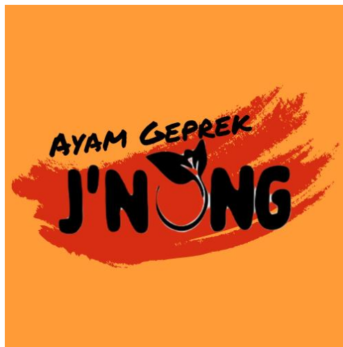
Gambar 1. 2 Logo Ayam Geprek J'nong

Ayam geprek adalah salah satu hidangan yang populer di Indonesia, dan sering dijual oleh para pedagang kaki lima, restoran, hingga warung makan. Ayam geprek merupakan salah satu jenis makanan yang saat ini sedang populer di Kota Bandung. Ayam geprek merupakan ayam yang digoreng kemudian diberi bumbu khusus yang bercita rasa pedas. Ayam geprek juga sering dijadikan sebagai makanan santap siang atau makanan di malam hari. Selain itu, ayam geprek juga menjadi salah satu pilihan makanan yang disukai oleh masyarakat Kota Bandung, terutama kalangan milenial.