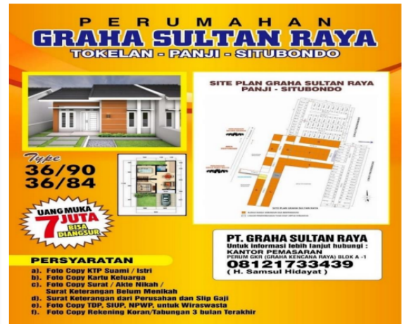
Gambar 2.1 MDLC

Pada tahapan ini, beberapa asset atau material disediakan oleh pihak perusahaan seperti gambar dan objek 3D, berikut adalah gambar dan gambar yang digunakan untuk pembangunan aplikasi,