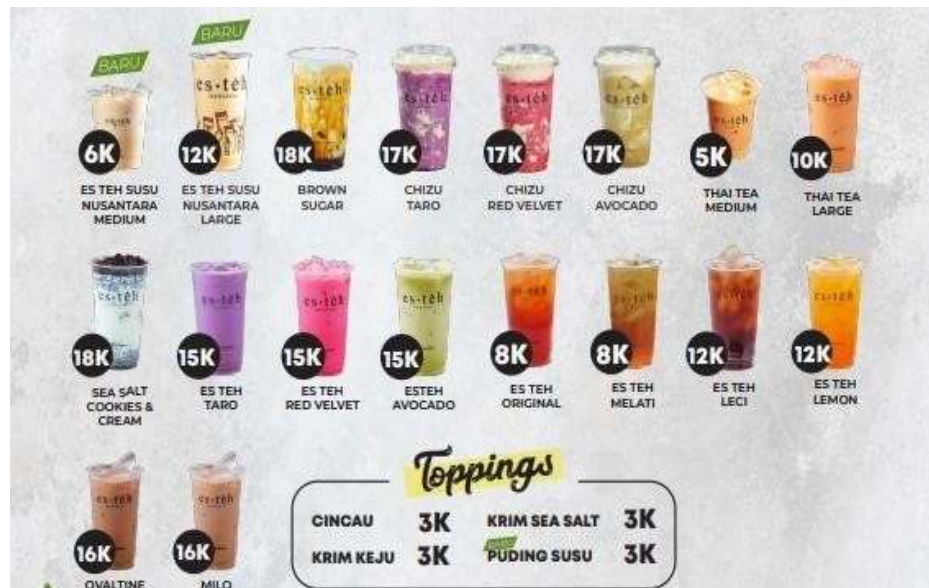
Gambar 1. 3 Beragam Produk Minuman Es Teh Indonesia

Adapun beragam produk dari Es Teh Indonesia adalah sebagai berikut: