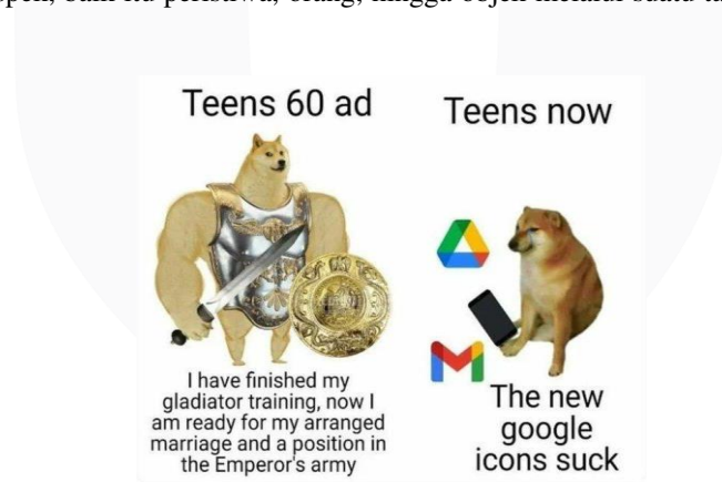
Gambar 1. Contoh meme Swole doge vs Cheems doge

Pada pertengahan Mei 2020, muncul format internet meme baru yang viral tersebar di berbagai platform sosial media, yang disebut Swole doge vs. Cheems doge . Meme ini berawal dari unggahan fanpage Doges Artesanales di Facebook pada 5 Februari 2020. Unggahan tersebut disebar oleh 10,000 user dan mendapatkan 3,300 reactions serta 510 komentar. Internet meme swole doge vs. cheems doge adalah meme satir yang membandingkan satu fenomena yang terjadi dalam masa historis yang berbeda, direpresentasikan oleh swole doge (atau yang sering disebut dengan chad ) sebagai fenomena yang terjadi pada masa lampau, dan cheems doge sebagai fenomena yang terjadi pada jaman sekarang. (Knowyourmeme.com, 2020) Representasi mengarah kepada suatu tindakan yang menggambarkan suatu aspek, baik itu peristiwa, orang, hingga objek melalui suatu tanda maupun simbol (Hall, 1997).