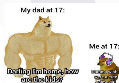
Gambar 4. Meme My Dad at 17 vs Me at 17