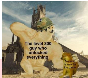
Gambar 3. Meme 300 you say