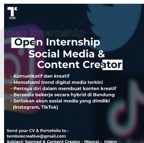
Gambar 6. Hiring Intern Social Media &amp; Content Creator