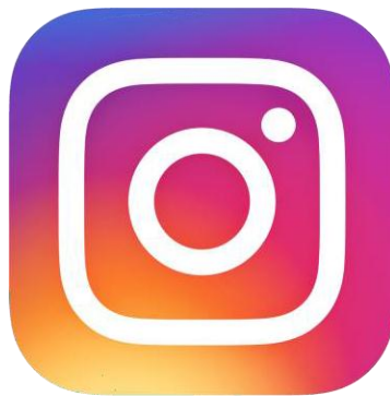
Gambar 1. 1 Logo Instagram

Instagram adalah salah satu aplikasi sosial media yang berbasis iOS, Android, dan Windows Phone dimana penggunanya dapat mengedit, posting foto maupun video dan membagikannya ke halaman utama Instagram dan jejaring sosial lainnya. Instagram merupakan sosial media yang berdiri pada 6 Oktober 2010 dan didirikan oleh Kevin Systrom dan Mike Krieger yang saat ini menjadi Chief Executive Officer (CEO) dari Instagram. Aplikasi Instagram adalah salah satu aplikasi yang saat ini berbasis iOS, Android, dan Windows Phone dimana penggunanya dapat mengedit, posting foto maupun video dan membagikannya ke halaman utama Instagram dan jejaring sosial lainnya.