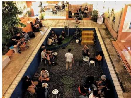
Gambar 1 View dari atas Kedai Duapuluhdua

keragaman dalam menawarkan fasilitasnya yang dapat menjadi daya tariknya semakin banyak.