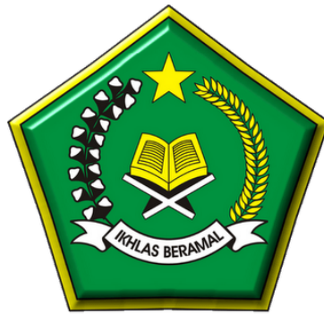
Gambar 1.1 Logo Kementerian Agama Republik Indonesia