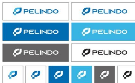
GAMBAR 1. 3

Pada Logo alternatif aman, konfigurasi bentuk dan penggunaan warna dari logo Pelindo untuk mempermudah pengaplikasiannya di segala media.