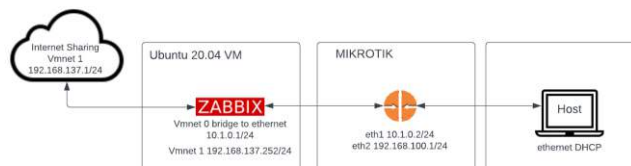
Gambar 3. 3 Topologi Sistem

Pada Gambar 3.3 merupakan topologi perancangan simulasi yang dilakukan pada pada Proyek Akhir ini. Zabbix diinstalasi di sistem operasi Linux Ubuntu 20.04 bebrbasis virtual. Zabbix terhubung dengan sebuah Mikrotik, Mikrotik disini digunakan sebagai perangkat simulasi pengganti dari OLT. Linux Ubuntu yang didalamnya sudah terinstal Zabbix terhubung juga ke Internet, hal tersebut dilakukan agar Zabbix bisa terhubung ke Telegram