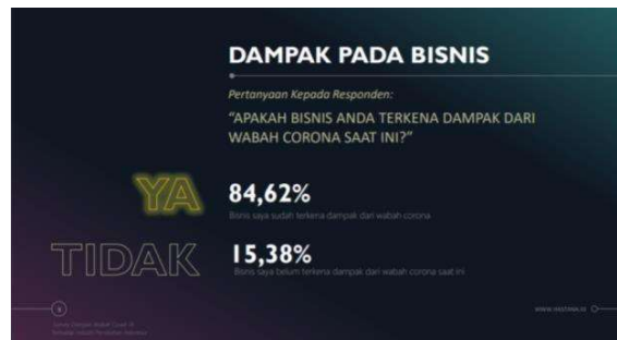
Gambar 1. 1 Hasil Survei Dampak COVID-19

Pelaku bisnis wedding planner tentunya tidak bisa diam saja untuk menyambung hidup di era ini. Berdasarkan hasil survey yang dilakukan Himpunan Perusahaan Penata Acara Pernikahan Indonesia (Hastana Indonesia) mengenai dampak Covid-19 pada industri pernikahan banyak sekali keputusan berat yang mereka lalui mulai dari pengurangan karyawan, beralih profesi, hingga menutup paksa bisnis wedding planner mereka.