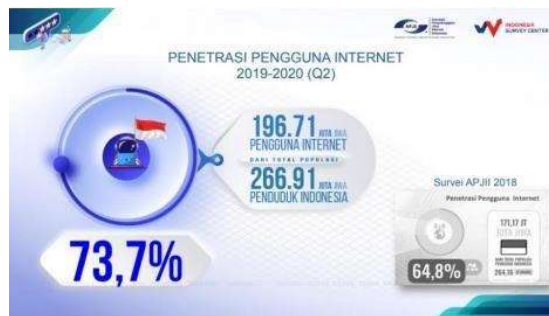
Gambar 1. 2 Data Pengguna Internet Di Indonesia