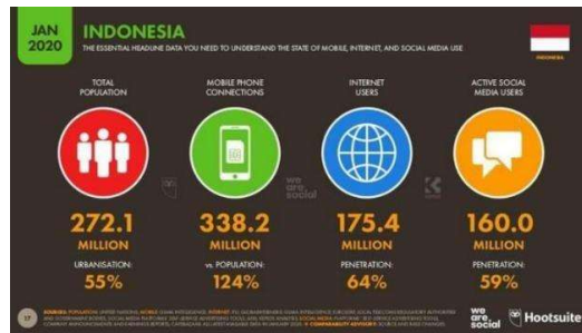
Gambar 1. 3 Data Perkembangan Dunia Digital Di Indonesia 2020

beberapa hal yang menarik terkait perkembangan dunia digital pada tahun 2020. Berikut adalah data terkait perkembangan dunia digital di Indonesia tahun 2020: