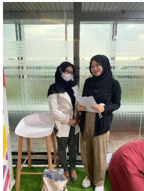
GAMBAR 5 WAWANCARA 4