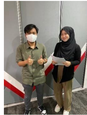
GAMBAR 6 WAWANCARA 5