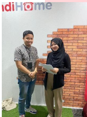
GAMBAR 3 WAWANCARA 2