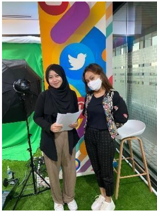
GAMBAR 2 WAWANCARA 1