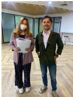
GAMBAR 4 WAWANCARA 3