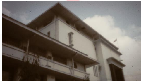
Gambar Kantor Distribusi Jabar

Dari sudut pandang yang mengarah ke langit menggambarkan kesan gagah terhadap gedung.