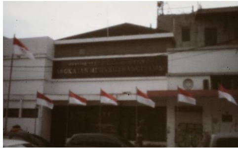
Gambar 10 Angkutan Muda Siliwangi

Angkatan muda siliwangi, dengan di tambahnya ornamen bendera merah putih menambahkan unsur perjuangan dan tempo dulu.