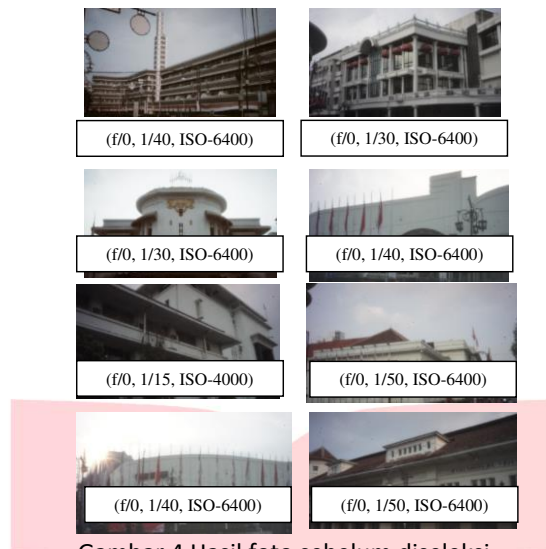
Gambar 4 Hasil foto sebelum diseleksi