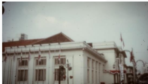
Gambar 6 Gedung Merdeka

Mengenal lebih dekat dengan Bandung dan sejarah didalamnya.