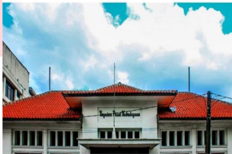
Gambar 2 Karya Indra Hermawan

Indra Hermawan kelahiran tahun 1996 merupakan fotografer asal Bandung menjadi salah satu referensi penulis pada karya fotonya yang diambil pada bulan desember 2021 di bangunan Gedung tua peninggalan bangsa Belanda yang masih berdiri kokoh sampai sekarang. Bangunan ini berada di Jl. Naripan Kota Bandung, di karyanya yang menjadi referensi penulis adalah angle pada foto tersebut. Gambar dibawah ini adalah salah satu referensi angle yang akan dipakai pada karya.