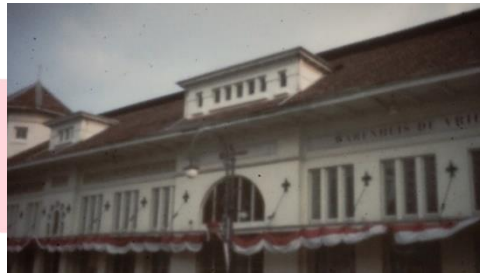
Gambar 5 Gedung De Vries

Masih gagah walau sudah tua dan lama berdiri, selama berjalan kaki aku nikmati cerita sejarahmu saat dulu.