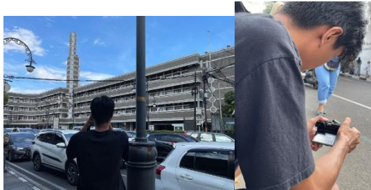
Gambar 3 Behind the scene

Penulis telah melakukan hunting di daerah jalan Asia-Afrika dan sekitarnya sebagai objek foto. Hunting sendiri adalah istilah yang biasanya digunakan oleh fotografer untuk mencari objek foto baik itu pemandangan, arsitektur, benda, manusia, hewan, dan jenis objek lainnya. Berikut adalah proses hunting yang telah penulis dokumentasikan.