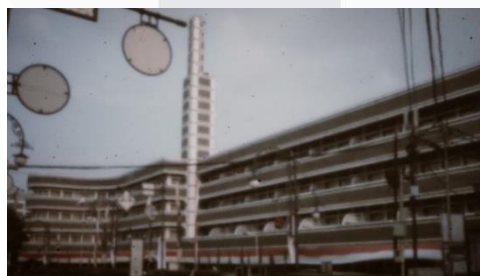
Gambar 9 Hotel Savoy Homann

Hotel Savoy Homann yang menawan dengan susunan warnanya.