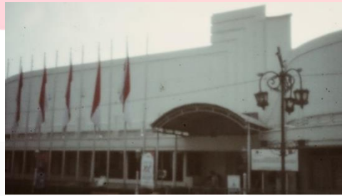
Gambar 8 Meseum Asia Afrika

Tempo ini menjelaskan banyak cerita di jalan raya, saat berjalan bersebelahan dengan gedung-gedungnya.