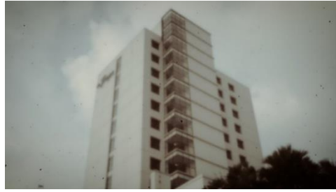
Gambar 7 Hotel De Braga

Tetap terlihat tua meskipun dibangun pada masa sekarang.