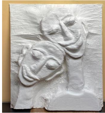
Gambar 12 . Kembali

Setelah menepi dan mengamati orang-orang dari jauh. Ada seseorang yang datang mendekat dan menjadi titik kembali. Dia merasa kedatangan sosok tersebut membuka jalannya untuk melihat dunia lebih luas, mengajarkan dia tentang banyak hal yang perlu di syukuri dan melupakan hal-hal negatif yang pernah terjadi dimasa lalu. Dan tetap melangkah maju karena masih banyak yang harus di explore. Dan perlahan melupakan masa lalu.