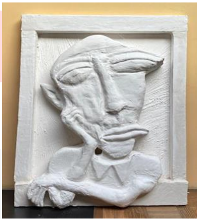
Gambar 11 . Menepi

Karena merasa kecewa dalam karya kedua ini penulis menggambarkan seseorang yang melihat keluar dari dalam jendela meninggalkan tempat ramai karena merasa sulit untuk menyesuaikan diri dengan tempat yang baru, dan susah bersosialisasi. Menepi yang di yang dimaksud adalah menyendiri jauh dari keramaian.