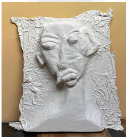
Gambar 10 . Awal Mula