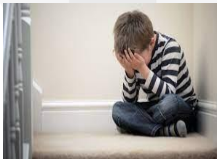
Gambar 5. Foto anak sedang meredam emosi

Dimulai dengan melankolis yang dirasakan oleh semua orang di lingkungan sekitar, fokusnya kemudian dipersempit lagi untuk memasukkan gejala depresi yang dialami setiap orang. Tujuan dari tugas akhir ini adalah untuk menciptakan