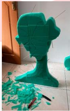
Gambar 8 . Proses Carving Gabus

Setelah mempertimbangkan beberapa teknik dalam pengerjaan Karya seni relief ini. Penulis memilih untuk menggunakan teknik Carving dalam pembuatan karya tugas akhir ini. Tanpa penulis sadari Teknik Carving atau Teknik Pahat ini adalah sebuah art therapy dan katarsis yang memiliki feedback baik pada penulis. Dalam proses pemahatan gabus ini perasaan negatif penulis seperti rasa sedih, marah, sulit konsentrasi penulis dapat mengeluarkan perasan tersebut dan berubah menjadi perasaan yang positif. Positif yang di maksud adalah perasaan penulis yang bisa lebih lega dan dapat berkonsentrasi ketika mengerjakan sesuatu.