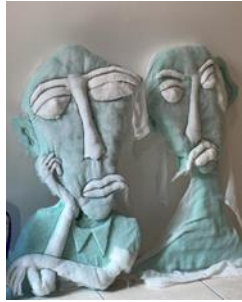
Gambar 9 . Pemasangan Kassa pada Gabus