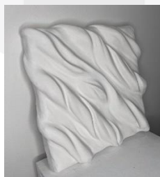
Gambar 3. Bonnie Lee Artwork

Merupakan seorang seniman yang berasal dari Newcastle Australia dan fokus dalam pembuatan karya seni dengan medium kayu dan kanvas yang dilapisi dengan gypsum. Dalam berkesenian Bonnie menggabungkan teknik cetak ukir dan pengamplasan dan lukisan dengan menggunakan bahan gypsum dan mortar.