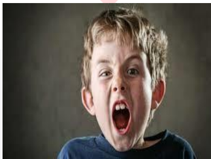
Gambar 4. Foto anak meluapkan emosi

Karena mencakup berbagai gerakan dan ekspresi organik, depresi berfungsi sebagai sumber inspirasi. Melankolis yang dimaksud adalah gejala yang berhubungan dengan depresi yang mempengaruhi lingkungan sekitar dan orang-orang yang dianggap dapat merangsang indra melalui karya seni relief.