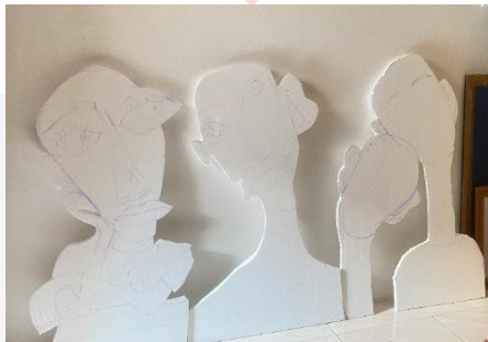
Gambar 6. Pola awal