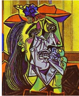
Gambar 2. The Weeping Woman (Sumber: Pablo Picasso/1937)