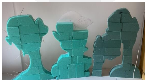
Gambar 7. Penempelan Gabus