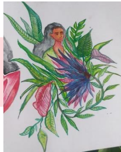
Gambar1.5 Sketsa tiga karya

Pada sebuah visualisasi sketsa untuk karya dua ini penulis menggambarkan sosok anak yang berada di dalam kandungan seorang ibu hal ini di maknai sebagai pengorbanan seorang ibu ketika sang buah hati berada di dalam kandungan, dan ketika melahirkan ibu pun bertaruh antara hidup dan mati demi kehidupan buah hati.