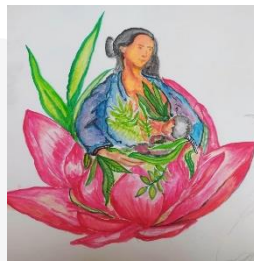
Gambar 1. 3 Sketsa awal karya

Sebuah proses pengkaryaan diawali dengan persiapan untuk mengalihkan suatu ide yang dijadikan sebuah konsep karya menjadi suatu visual pengkaryaan berupa rancangan awal yaitu sketsa untuk karya, pada tahapan ini berfokus untuk mencari sebuah visual yang akan di hadirkan ke dalam karya yang cocok dengan sebuah konsep karya.