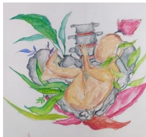
Gambar 1. 4 Sketsa dua karya

Visualisasi untuk karya pertama menggambarkan sosok seorang ibu yang menggendong anak dengan rasa sayang dan memberikan sebuah kehidupan, pemaknaan tumbuhan di dalam setiap visualisasi adalah sebuah bentuk rasa merawat dan menjaga dengan penuh kasih sayang terhadap anak.