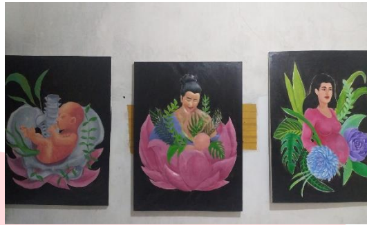
Gambar 1.7 Hasil karya

Setelah pemasangan darkron penulis pun mulai memfinishing karya nya dengan memwarnai background warna hitam lalu proses pemolesan clear terhadap karya, pengolesan menggunakan clear akrilik agar karya menjadi bersih dan tidak mudah rusak pada cat yang di gunakan.