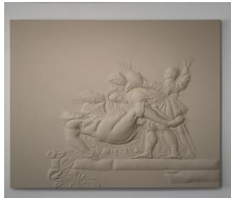
Gambar 1. 1 Karya valasara