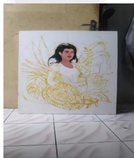
Gambar 1. 6 Sketsa 3 dari kertas ke kanvas

Kanvas yang telah di Lukis sesuai dengan sketsa akan di lakukan proses pemasukan kain kanvas di belakang kanvas yang ada visual sehingga kanvas tersebut memiliki dua lapisan depan dan belakang