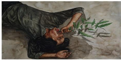
Gambar 1.2 Karya Bambang Nurdiansyah