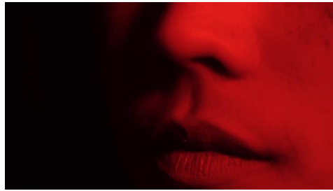
Gambar 8 Cermin

Detail ke bagian tubuh yang dapat meruntuhkan karirnya yaitu bibir, yang dimana filosofi dari pengambilan ini adalah lidah/bibir lebih tajam daripada pisau. Bersamaan juga dengan perilaku wanita ini yang sombong dan angkuh dengan sikapnya.