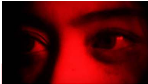
Gambar 6 Cermin

Pengambilan gambar yang sangat detail menunjukkan kekosongan dari tatapan wanita tersebut memberikan kesan tidak baik dari gestur maupun pikiran.