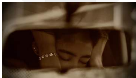
Gambar 5 Cermin