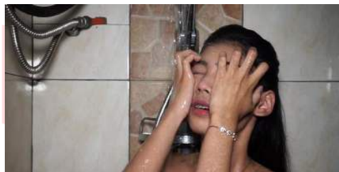
Gambar 2 Bathroom