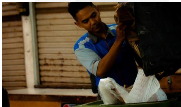
Gambar 8 An Honest Work

Cerita foto : Foto seorang penghibur jalanan yang berlokasi di bawah jembatan ciwalk, Setiap harinya dia bekerja mencari nafkah untuk memenuhi kebutuhan sehari-harinya. Beliau tinggal di tengah kota, namun pekerjaan sehari-harinya hanyalah sebatas menjadi sang penghibur jalan.