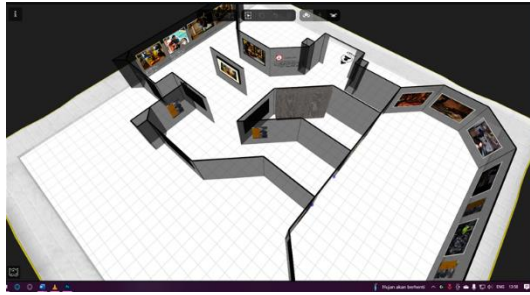
Gambar 5 Proses pembuatan ruangan virtual

Display karya di lakukan dalam ruangan virtual yang menggunakan aplikasi artstep dan di design sedemikian rupa berdasarkan hasil diskusi dan masukan dengan pembimbing. Lalu saat pada pendisplayan karya dapat di lihat dengan cara menggunakan gadget, komputer, maupun laptop masing masing.