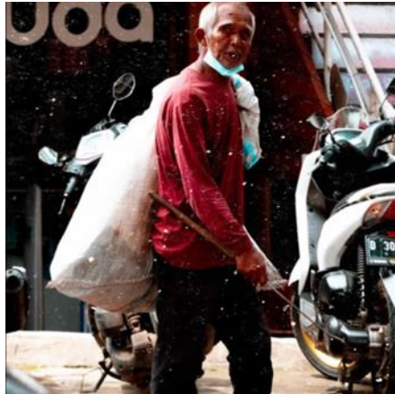
Gambar 10 Plastic Is Gold