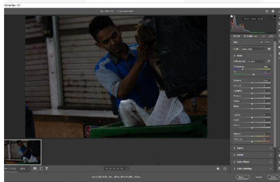
Gambar 4 Proses pengeditan foto

Proses selanjutnya adalah pengeditan foto dimulai dari perbaikan warna. Karakter warna yang penulis coba kejar disini merupakan karakter warna yang dramatis sehingga dapat mengangkat cerita pada foto lebih baik. Lalu langkah selanjutnya penulis membuat layer-layer foto, hal ini dilakukan untuk mempermudah penulis dalam pembuatan ruangan dan pergerakan foto menjadi sebuah animasi 3D, setelah itu penulis membuat ruangangan 3D dan juga memberikan animasi 3D kepada setiap layer yang sebelumnya sudah dibuat. Hal terakhir dalam pengeditan foto yaitu pemberian efek mist , dust , dan yang lainnya sebagai finishing touch .