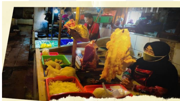
Gambar 6 Quiet Crowded Place

Berikut penjelasan detail setiap hasil karya yang penulis telah buat :