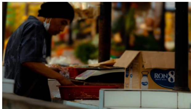
Gambar 9 Quiet Life

Cerita foto : "Hal ini tidak lah seberapa, tetapi setidaknya ini pekerjaan yang halal". Itulah apa yang pria ini katakan, mencari pekerjaan di tengah kota itu tidaklah mudah, seperti yang foto ini dapat tunjukan. Ini adalah Foto seorang penjaga kebersihan di pasar Batununggal yang merupakan daerah kota.