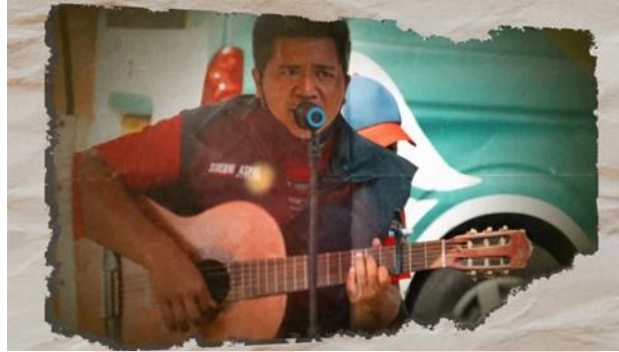
Gambar 7 Penghibur Jalanan

sang penjual daging merasa resah, keresahan ini dapat terlihat dari matanya, bertanya-tanya apakah dagingnya akan terjual habis atau tidak.