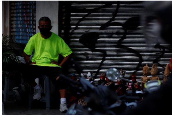
Gambar 3 salah satu foto yang penulis dapatkan Sumber : dokumentasi penulis, 2022

dan sesuai vibe nya dengan apa yang sebenarnya terjadi atau dirasakan pada saat pengambilan foto atau gambar tersebut.