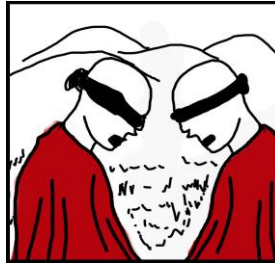
Gambar 2. Sketsa karya "Sebagian Golongan - II"

Latar yang digunakan dalam karya yaitu alam. Kemudian terdapat dua manekin yang berhadapan seolah sedang berbicara yang dipakaikan kain merah dan penutup mata kain hitam.