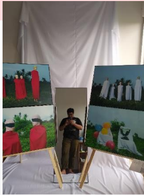
Gambar 9. Display Karya

Dalam penempatan karyanya, ide yang diambil yaitu membuat instalasi latar dengan menggunakan kain putih dan akan menggunakan cermin di antara atau tengah karyanya.