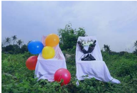
Gambar 6. Karya berjudul "Tak ada peminatnya"

Karya ini yaitu visualisasi bait lirik 22 dan 23 yang merupakan bagian reff "Dan turut berduka cita, atas tak berartinya bunga.(22) Terganti umpat benci, caci maki, bunuh dan lukai, benci dan lukai (23) "