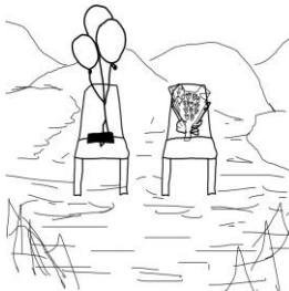
Gambar 4. Sketsa karya "Tak Ada Peminatnya"