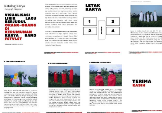
Gambar 11. Katalog digital karya Sumber: Milik pribadi penulis

Dalam gambar 36. display terdapat kertas yang berisi layout karya, judul, dan media yang digunakan sebagai petunjuk karya. Kemudian terdapat barcode di kertas display tersebut yang nantinya jika dibarcode akan muncul katalog karya berisi penjelasan empat karya tersebut.