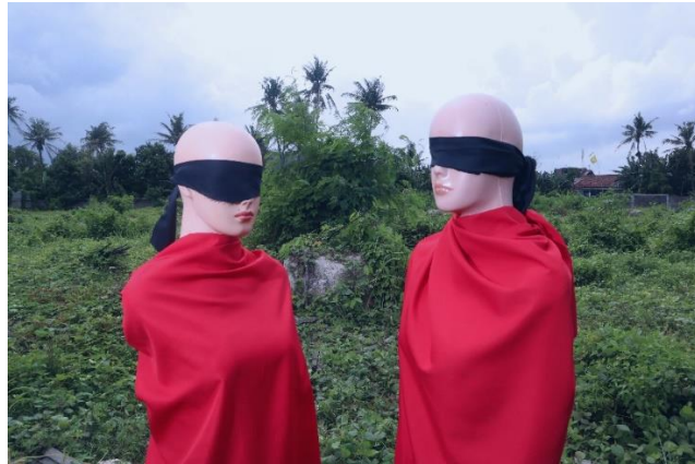
Gambar 8. Karya berjudul “Sebagian Golongan II”

Karya ini bentuk visual dari bait lirik nomer 7 “ Yang seiman saling menerakakan (7) ”,