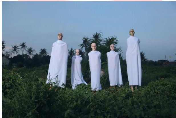
Gambar 5. Karya berjudul "Sama atau Berbeda?"

Karya ini bentuk visual dari bait lirik 10 dan 11 " Bahwasanya aku kau mereka sama,(10) hanya manusia, sama manusianya (11) " Gambaran yang digunakan sebagai bentuk visualnya yaitu latar yang digunakan berada di alam, hal ini untuk merepresentasikan manusia diciptakan melalui alam yang sama. Kemudian manekin berjumlah lima berjajar menggunakan kain putih diartikan sebagai semua manusia diciptakan dalam keadaan suci. Bentuk manekin yang tidak sama seperti tinggi yang berbeda, diartikan sebagai pesan yaitu walau bentuk fisik mereka berbeda, tetapi bukan berarti derajat mereka berbeda juga.