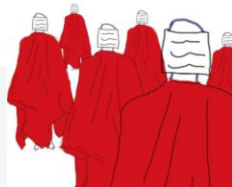
Gambar 3. Sketsa karya "Sebagian Golongan - I"

Dalam sketsa karya ini, terdapat lima manekin yang menggunakan kain merah dan dan seolah berjalan ke ke arah yang sama.