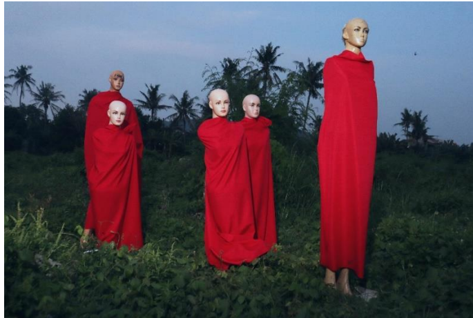
Gambar 7. Karya berjudul “Sebagian Golongan I”

Karya berikutnya berjudul “ Sebagian Golongan I ” bentuk visual dari bait lirik nomer 1,2, 3, dan 4 “ Orang-orang di kerumunan berjejalan di lingkaran,(1) Mengitari satu altar sesembahan,(2) Mereka menari dengan mata terpejam, kerasukan,(3) Jiwanya sudah tak lagi bersemayam(4) ”.