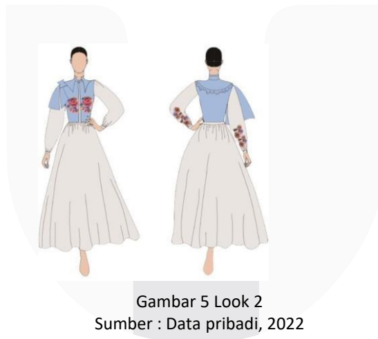
Gambar 5 Look 2