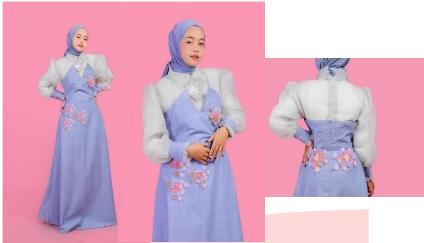
Gambar 9 Look 3 lifa dress