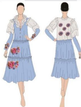
Gambar 4 Look 1