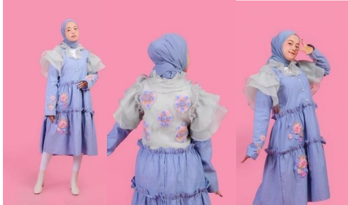
Gambar 7 Look 1 nana midi dress