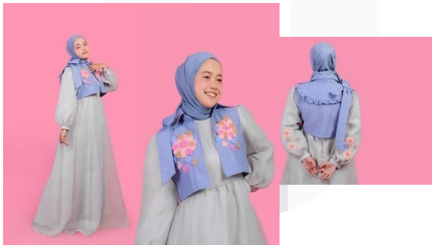
Gambar 8 Look 2 liza dress