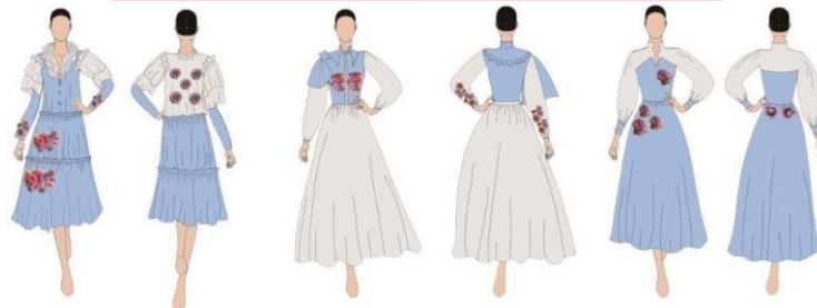
Gambar 3 Sketsa design terpilih

Terdapat 2 jenis bahan yang digunakan pada desain ini yaitu kain denim oxford dan organza. Kain denim oxford berwarna biru dan kain organza berwarna silver muda. Dari sepuluh sketsa alternative, terdapat 3 look terpilih yang berpotensi untuk dilanjutkan ke proses produksi busana, di antaranya adalah: