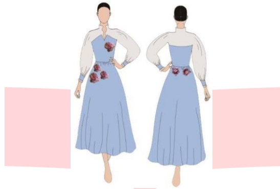
Gambar 6 Look 3 Sumber : Data pribadi, 2022

Konsep dress panjang dengan bustier dan kerah tegak ke atas seperti turtleneck dengan dibawahnya terdapat lengkukan ruffle, pada bagian bustier diberi kain keras sehingga bisa tegak dan terpisah pada kain organzanya. Pengaplikasian motif pada dada, paha, punggung dan pinggul belakang. Bagian lengan di bentuk mengembang supayaterkonsep fun and happiness . Dress ini penulis beri nama “Lifa Dress” nama tersebut diambil dari nama penulis, karena ini merupakan produk yang penulis suka dan akhirnya bisa mewujudkan sendiri dengan hasil yang cukup maksimal.