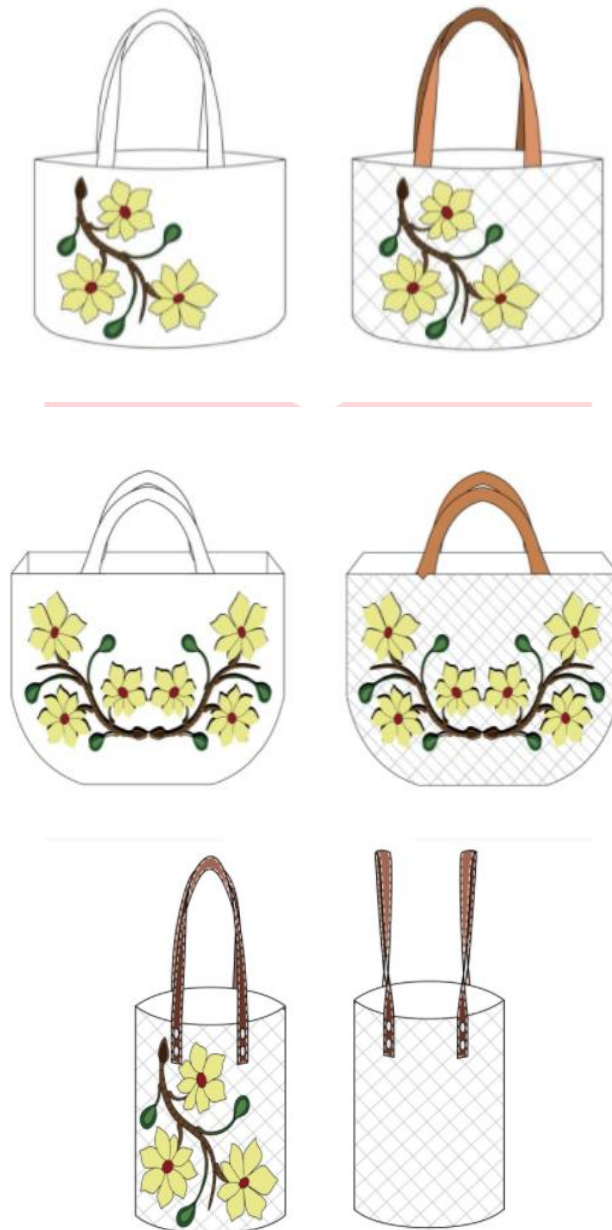
Gambar 4 Desain penggabungan produk dengan teknik bordir

Kemudian untuk menambah daya tarik dibuat sebuah Merchandise yang merupakan sebuah komponen untuk memperkenalkan, mempromosikan, dan mempertegas sebuah image brand kepada costumer . Merchandise dibuat