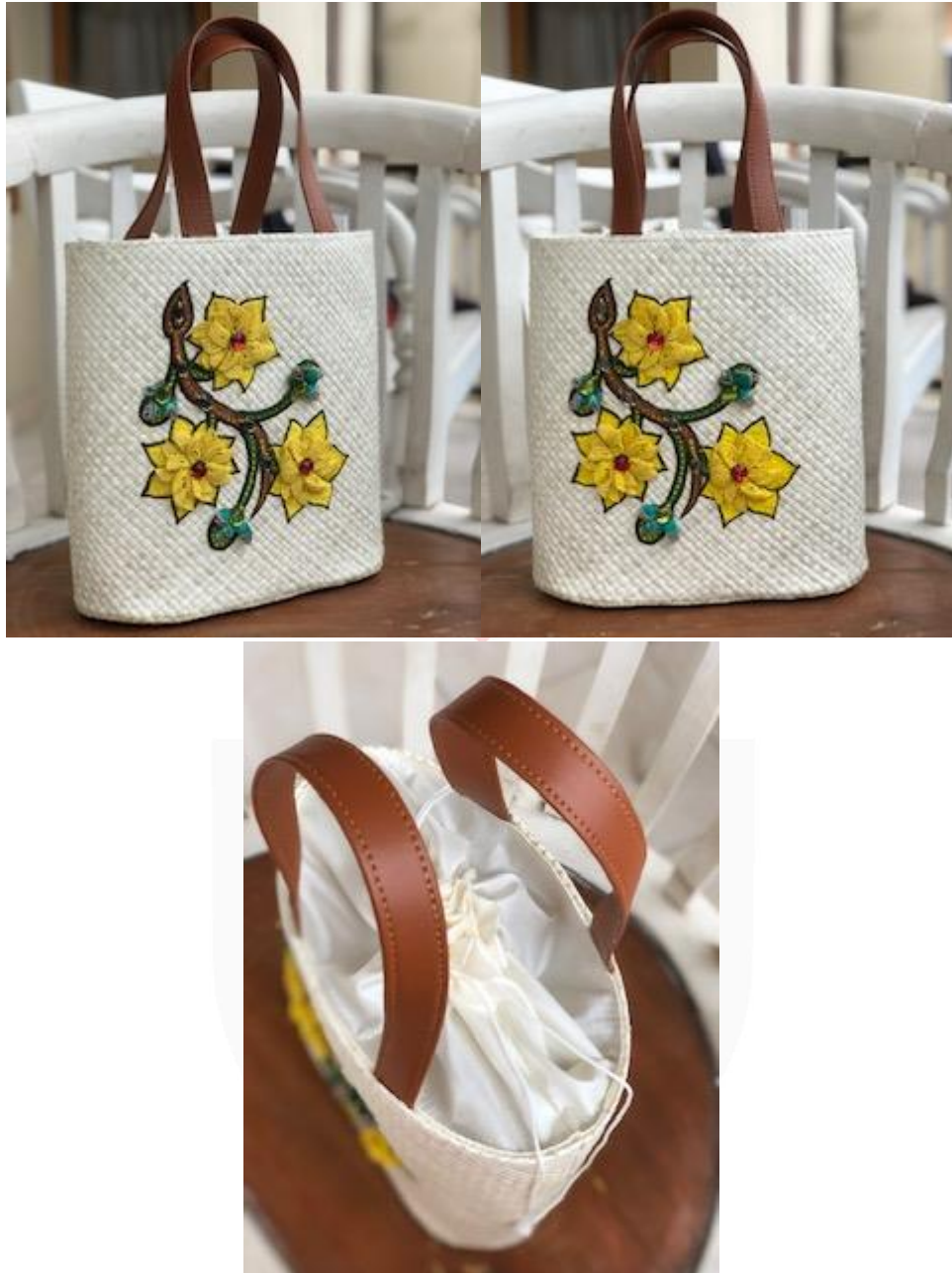
Gambar 8 Visualisasi produk akhir desain kedua