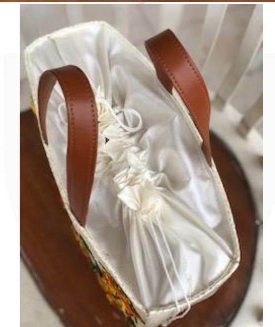
Gambar 7 Visualisasi produk akhir desain kedua