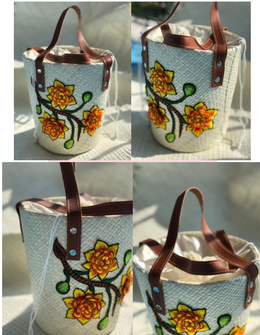
Gambar 6 Visualisasi produk akhir desain pertama