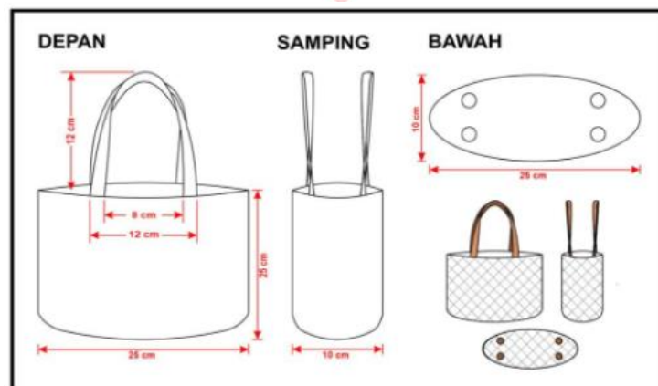
Gambar 1 Sketsa produk 1

Pemilihan sketsa produk ini dilakukan setelah melakukan pemilahan produk yang sebelumnya ada di UKM Rafi Craft. Setelah didapatkan produk pilihan, kemudian dilanjutkan dengan pembuatan sketsa lengkap. Gambar1 sampai dengan Gambar 4 merupakan sketsa produk yang dibuat oleh penulis yang nantinya akan diproduksi bersama UKM.