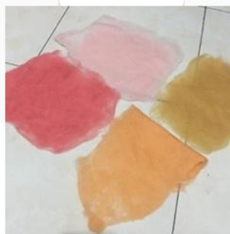
Gambar 1. Lembaran felting