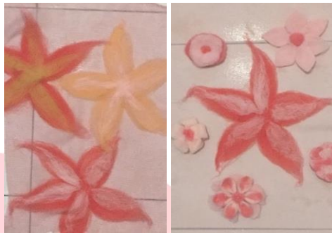
Gambar 3. Lembaran nuno felting dengan elemen dekorasi floral