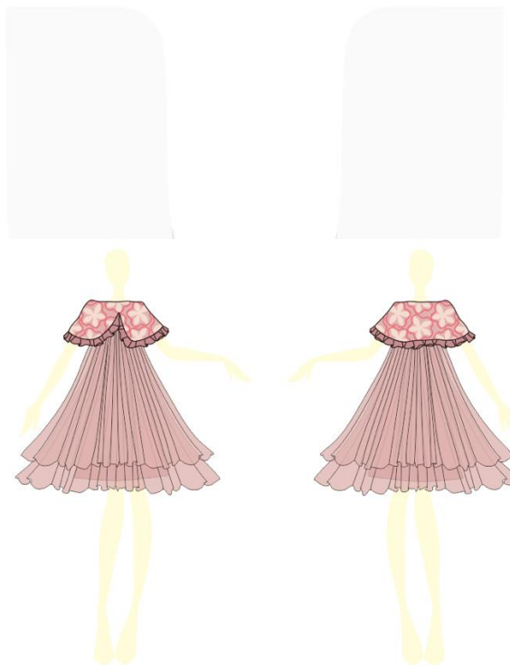
Gambar 8. Sketsa Busana I