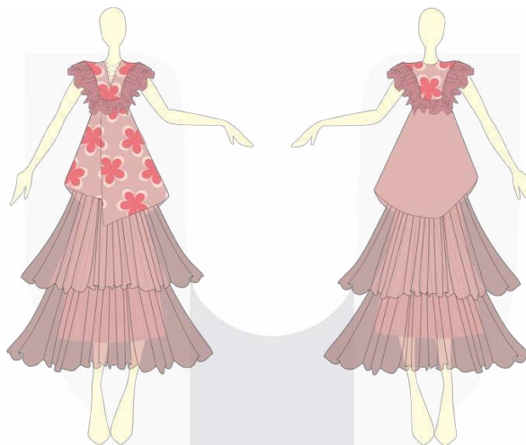
Gambar 10. Sketsa Busana III