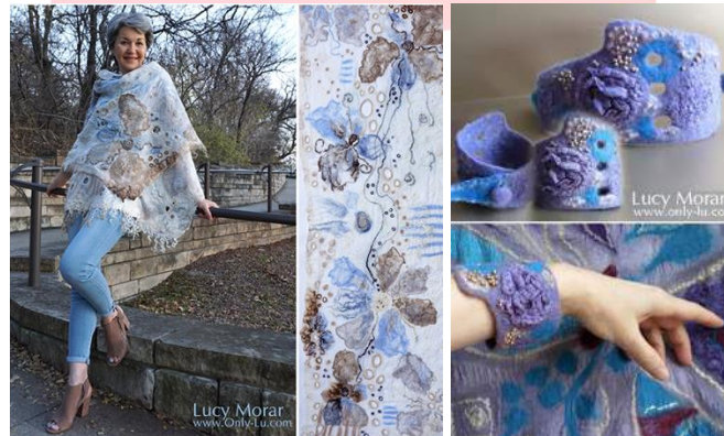
Gambar 6. Produk-produk Only Lu