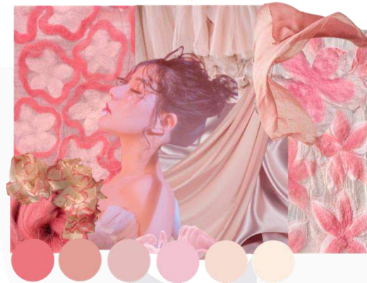
Gambar 7. Image Board