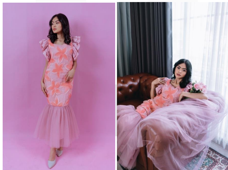
Gambar 12. Visualisasi produk busana I