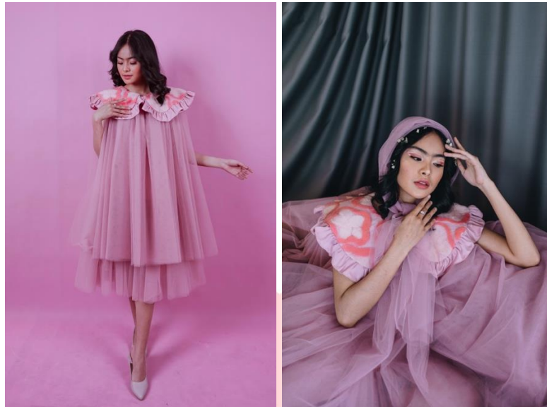
Gambar 11. Visualisasi produk busana I