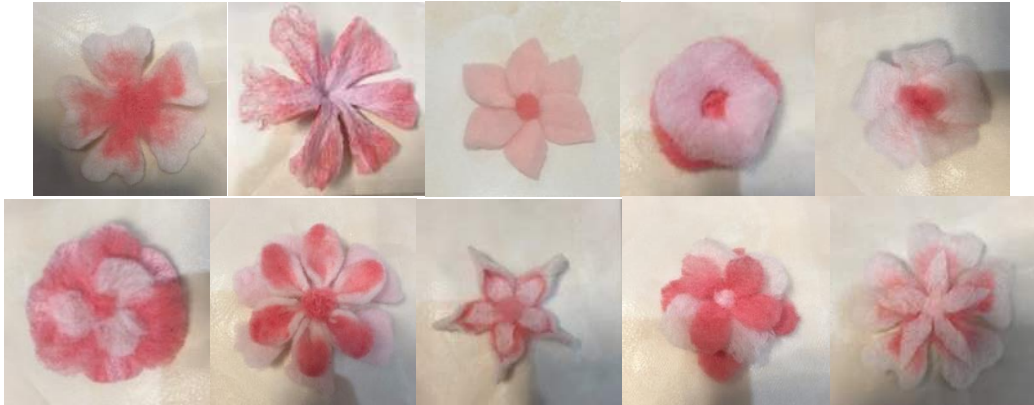
Gambar 2. Elemen dekorasi floral dengan teknik nuno felting