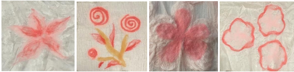
Gambar 4. Lembaran nuno felting yang berhasil dan hasilnya baik