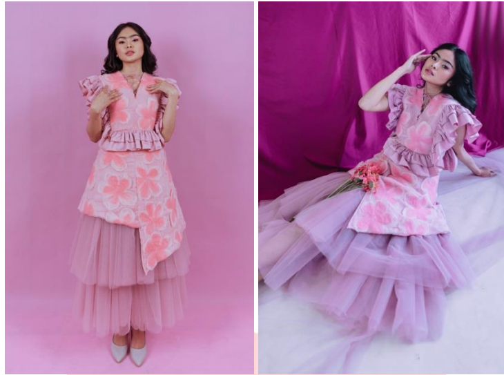
Gambar 13. Visualisasi produk busana III