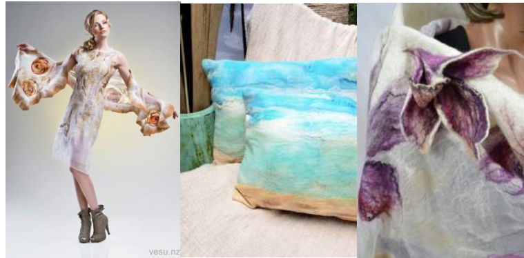
Gambar 5. Produk-produk Vesu.nz