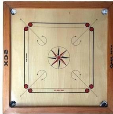
Papan Karambol