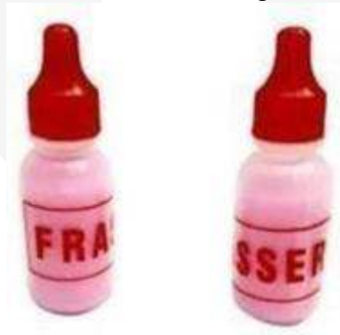
Pelicin Papan Karambol