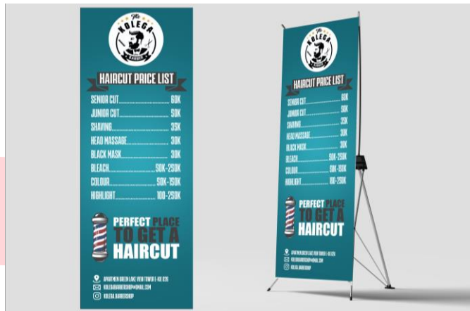
Gambar 5 Pricelist banner

Menarik minat melalui konten feed Instagram dengan isi informasi dari produk dan isi informasi tentang Kolega Barbershop itu sendiri. Dengan desain yang menarik akan menambah menarik minat Target Audience .