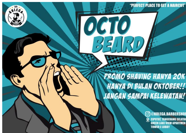
Gambar 7 Themed event octo beard

Themed event sebuah tindakan dari Kolega Barbershop untuk di Social media instagram maupun di toko. Event ini berupa promosi berjangka waktu yang di tampilkan di social media Instagram berupa event promosi yang memiliki tema yang unik dan beragam. Seperti contohnya event Octo Beard, event ini berupa event promosi yang diadakan di bulan oktober, berupa promo harga untuk jasa layanan shaving beard hanya senilai Rp20.000 yang awalnya harga untuk jasa ini adalah Rp 35.000.