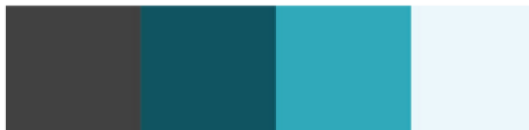
Gambar 2 Pemilihan warna

Dalam proses pengerjaannya, penulis memilih warna yang identik dengan gender laki-laki yaitu biru dan warna netral yaitu abu tua dan putih.