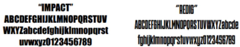
Gambar 3 Tipografi

Tipografi Jenis tipografi yang dipilih adalah jenis tipografi Sans-Serif dan lebih tepatnya adalah jenis font Impact yang berkesan tegas serta Redig untuk kesan maskulin.