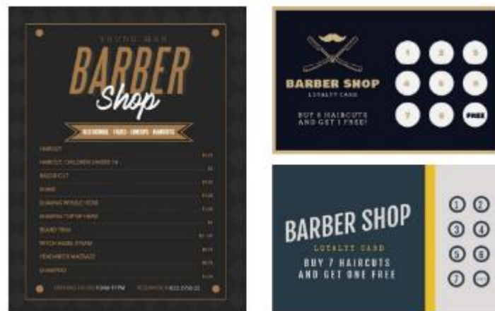
Gambar 1 Gaya visual

Berdasarkan observasi yang dilakukan, penulis menggunakan gaya visual yang sesuai dengan gaya dari barbershop yaitu simple dan maskulin, tidak norak. Gaya visual yang digunakan untuk menunjukkan sisi elegan dan maskulin yang cocok untuk konten nantinya.