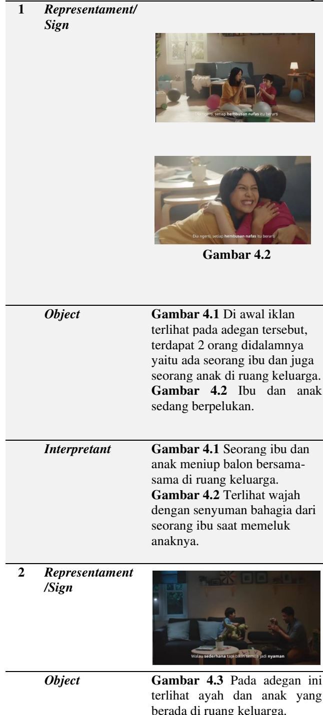
Tabel 4.1 Scene Iklan IKEA versi “Bersama IKEA Maknai Setiap Momen”

Terdapat 5 scene dan 8 gambar yang dianggap merepresentasikan suatu keluarga yang harmonis. Yaitu :