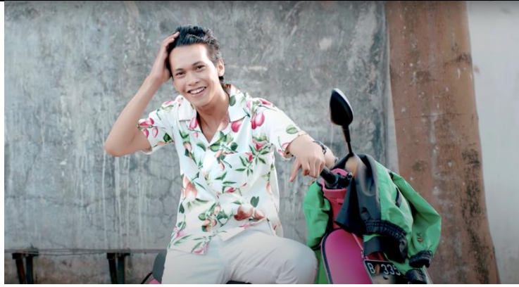
Gambar 4. 4 Cuplikan Iklan MS Glow For Men Detik 0:06 – 0:07