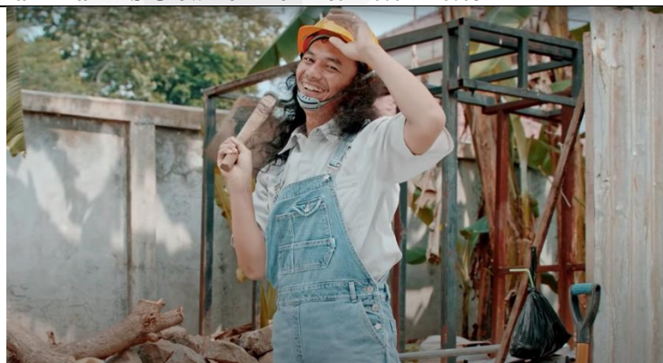
Gambar 4. 2 Cuplikan Iklan MS Glow For Men Detik 0:01 – 0:03