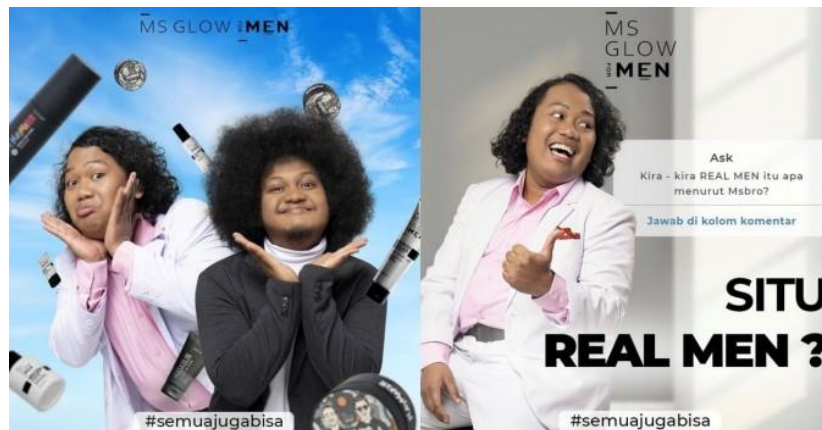
Gambar 1. Iklan Instagram MS Glow for Men "Semua Juga Bisa"