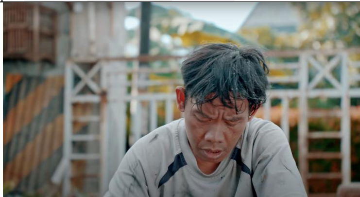
Gambar 4. 5 Cuplikan Iklan MS Glow For Men Detik 0:09 – 0:10