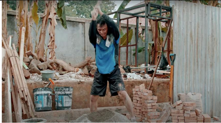
Gambar 4. 1 Cuplikan Iklan MS Glow For Men Detik 0:00 – 0:02