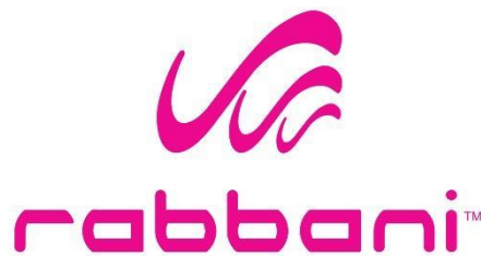
Gambar 1.1 Logo Rabbani