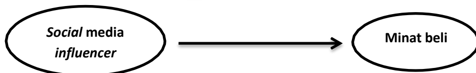
Gambar 2.4 Kerangka Pemikiran Sumber : Dalangin et al.,2021

Dalam pengujian hipotesis dapat dilihat dari nilai p-value dan koefisien jalur (path coefficient). Untuk pengujian hipotesis yaitu dengan menggunakan nilai statistik maka untuk alpha 5% nilai p-value yang digunakan adalah 0,05. Sehingga kriteria penerimaan/penolakan hipotesis adalah H1 diterima dan H0 di tolak ketika p-value < 0,05 . Untuk menentukan arah hubungan antar variabel dapat dilihat melalui koefisien jalur (path coefficient), apabila koefisien jalur bernilai positif menunjukkan hubungan positif antar variabel, apabila koefisien jalur bernilai negative menunjukkan hubungan negative antar variabel.