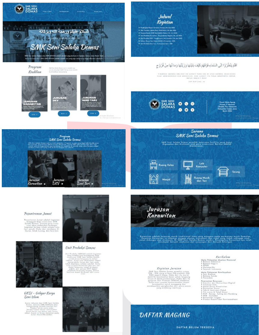
Gambar 3 Tampilan website