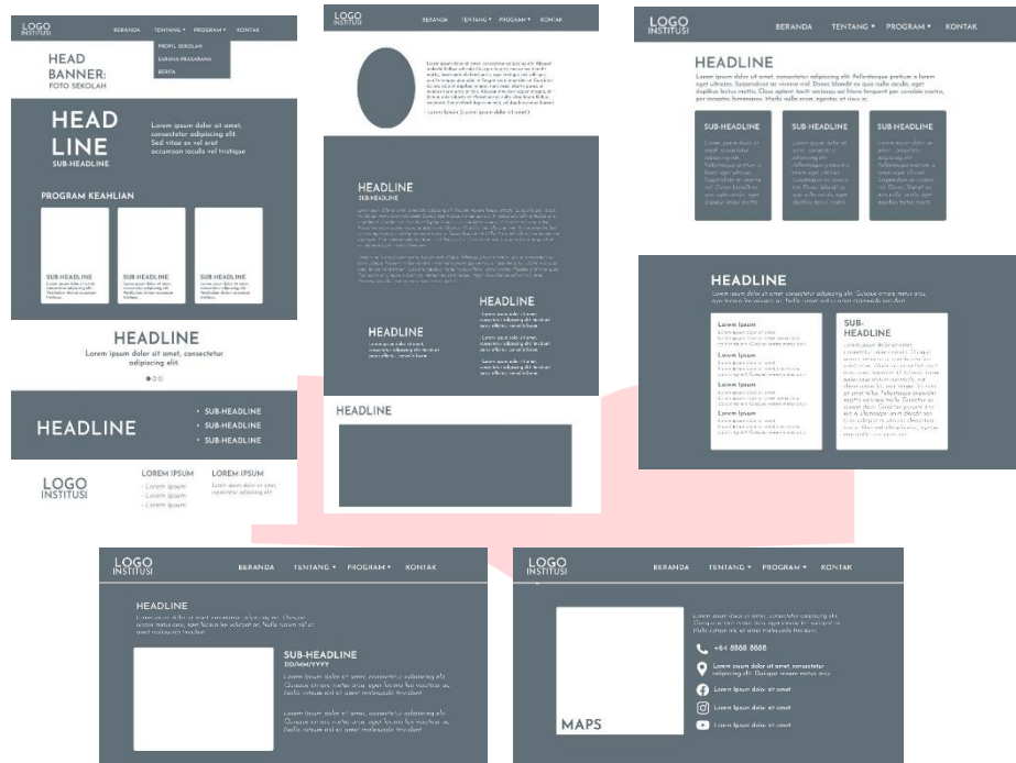
Gambar 2 Wireframe

Pembuatan website sepenuhnya menggunakan carrd.co, dengan alasan pembuatannya jauh lebih murah dan penggunaannya lebih mudah digunakan untuk orang awam. Sehingga para pengurus SMK Seni Salaka Domas pun dapat menggunakan dan menyusun konten websitenya dikemudian hari. Kata kunci yang dapat menjadi representasi website ini adalah tradisional, simple dan elegan