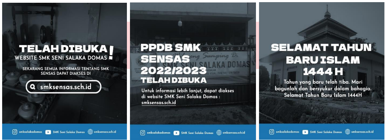
Gambar 4 Media pendukung

Poster online dapat dibagikan di platform media sosial seperti instagram dan facebook. Isinya adalah hal yang berhubungan dengan SMK Seni Salaka Domas, dapat berupa ucapan selamat ataupun informasi yang dapat dilihat oleh khalayak banyak. Pada tiap postingannya akan selalu di tampilkan link website, username instagram dan akun youtube SMK Seni Salaka Domas