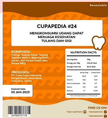
Gambar 5 Rancangan kemasan udang bagian belakang