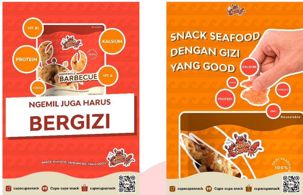
Gambar 6 Rancangan poster cetak attention