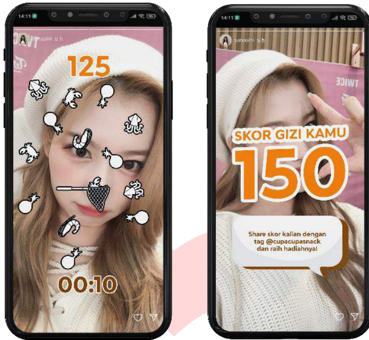
Gambar 3 Advergame catch!