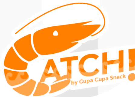
Gambar 2 Logo catch!

Merupakan media utama yang digunakan untuk menarik audiens yakni permainan menggunakan fitur filter pada kamera dalam aplikasi Instagram. Nantinya setiap pemain yang berhasil akan mendapatkan reward untuk bisa lebih menarik audiens.