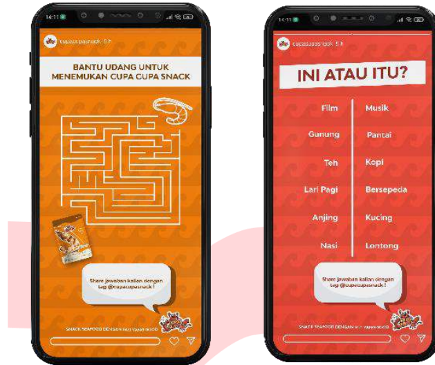
Gambar 14 Story interaktif instagram

Konten story interaktif bertujuan untuk bisa lebih berinteraksi dengan audiens agar audiens membangun persepsi ramah, bersahabat dan menyenangkan.