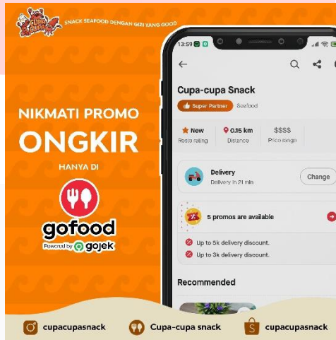
Gambar 12 Feeds persuasif instagram