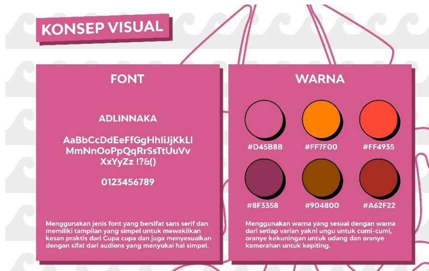
Gambar 1 Tipografi dan Warna