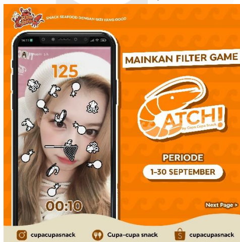
Gambar 13 Feeds interest instagram Sumber: amrullah, 2022