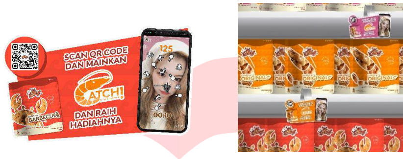
Gambar 9 Wobbler interest