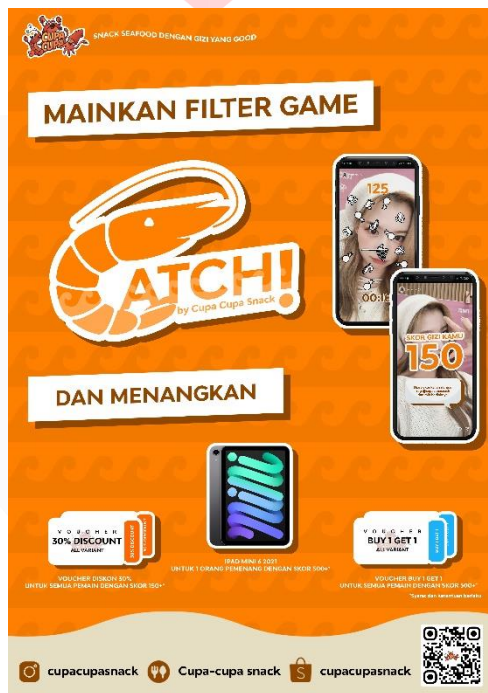
Gambar 7 Rancangan poster cetak interest