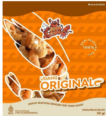
Gambar 4 Rancangan kemasan udang bagian depan