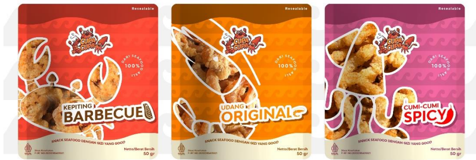
Gambar 3 Rancangan kemasan

Perancangan kemasan dengan visual yang sederhana untuk mewakili kesan praktis Cupa cupa dan pemilihan warna yang sesuai dengan masing-masing variang.