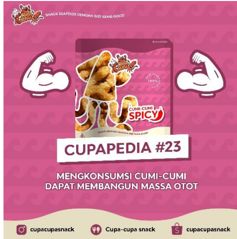
Gambar 11 Feeds Informatif instagram