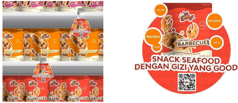
Gambar 8 Wobbler attention