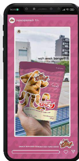
Gambar 15 Frame repost instagram

Setiap dari pengalaman yang dirasakan konsumen akan di- posting ulang menggunakan frame agar lebih tertata dan terlihat profesional.