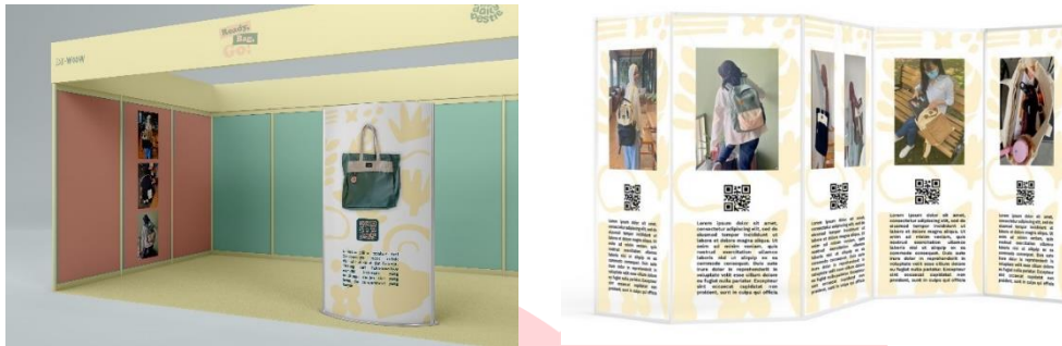
Gambar 8, Mini Exhibition

mengingat banyaknya minat masyarakat Bandung terutama usia yang menunjukkan target audience Zakwoowstyle memiliki angka minat yang cukup besar dalam berkunjung ke café