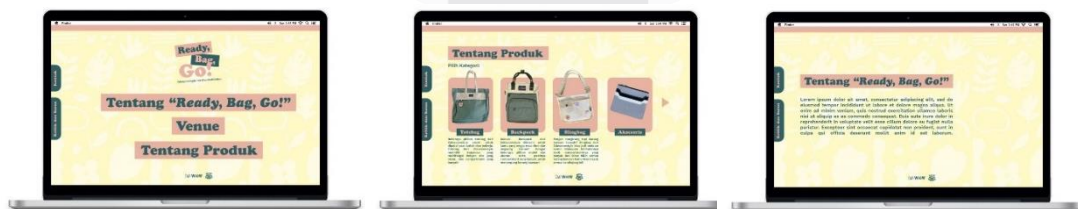
Gambar 7, Website

Website dapat menjadi salah satu media informasi sekaligus media pendukung dari event mini exhibition sebagai media utama. Memanfaatkan fiturnya yang beragam, website dari event mini exhibition ini akan menjelaskan tentang produk-produk apa saja yang dijual oleh Zakwoowstyle dan timeline atau update tentang mini exhibition Zakwoowstyle.