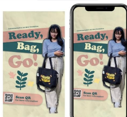
Gambar 5, Instagram dan Facebook Ads

Instagram dan Facebook Ads. Ditinjau dari wawancara Bersama target audience, Instagram dan Facebook menjadi salah satu sosial media yang paling sering dilihat setiap harinya. Instagram & Facebook Ads dapat menjadi salah satu sarana penyebaran informasi dan awareness agar pesan dapat tersampaikan kepada target audience