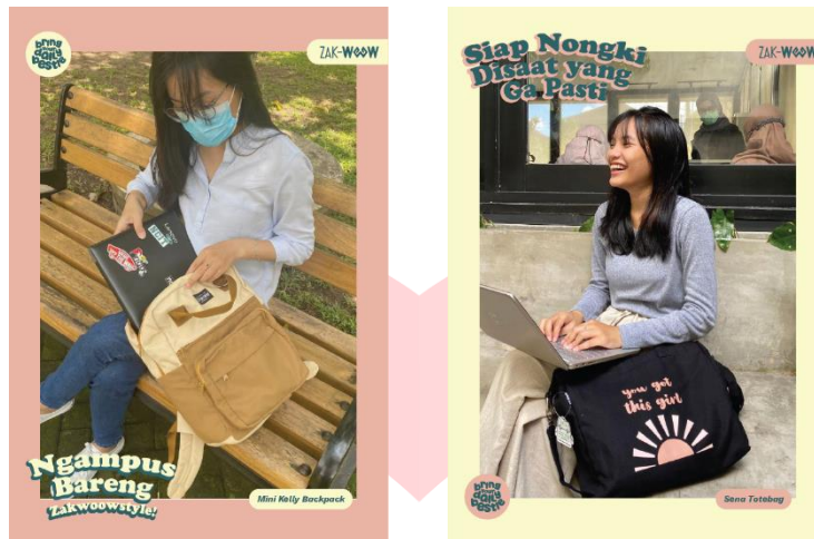
Gambar 4, Print Ads

Print Ads berupa poster yang akan ditempel di beberapa ruas jalan di Kota Bandung. Print Ads bertujuan untuk membangun awareness target audience yaitu mahasiswa dan pekerja wanita awal di Kota Bandung akan adanya brand Zakwoowstyle.