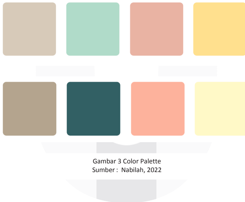
Gambar 3 Color Palette

Warna , Pemilihan color palette Zakwoowstyle terinspirasi dari warna-warna produk barunya yang mayoritas memakai warna coklat, biru, pink, dan kuning soft . Pemberian warna coklat muda identik dengan warna earth tone yang sedang digandrungi oleh banyak remaja sampai orang dewasa khususnya wanita saat ini. Warna earth tone memiliki kesan halus, santai, kalem, dan juga terlihat dewasa dengan kesan simpelnya. Dilengkapi oleh warna hijau, merah muda, dan kuning pastel halus yang melambangkan tema fancy yang dipadupadankan dengan mature . Maka dari itu, perpaduan warna mature (coklat muda) dan fancy (hijau, merah muda, dan kuning pastel halus) memberikan kesan konsep warna yang akan diusung di rancangan visual maupun media Zakwoowstyle.