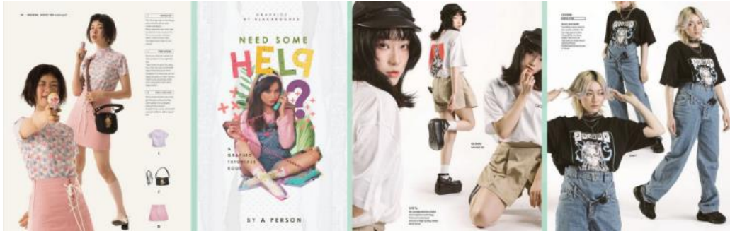
Gambar 1 Montage/Kolase Design

Menurut Ahmad Zainudin (2021) dalam STEKOM, disebutkan bahwa salah satu tren visual yang digandrungi oleh para remaja diatas 17 tahun salah satunya adalah montage dan collage atau biasa dikenal dengan gaya kolase. Remaja saat ini juga sangat memperhatikan keestetikaan sebuah desain dan cenderung menyukai warna yang soft seperti warna nude atau earth tone .