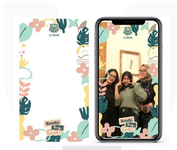
Gambar 9, Instagram Filter