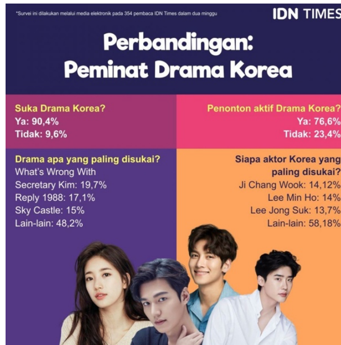
Gambar 1. 2 Data peminat drama Korea