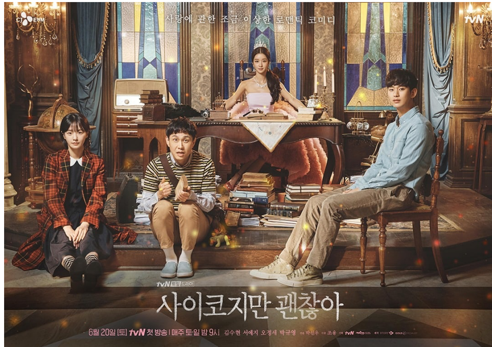
Gambar 1. 3 Poster drama It's Okay Not To Be Okay

karakter yang sama pentingnya yaitu kakak Gang-tae yang bernama Moon Sang-tae (Oh Jung-Se) dan mempunyai Autism Spectrum Disorder (ASD). Plot Drama It's Okay Not To Be Okay ini berputar pada kehidupan ketiga karakter tersebut.