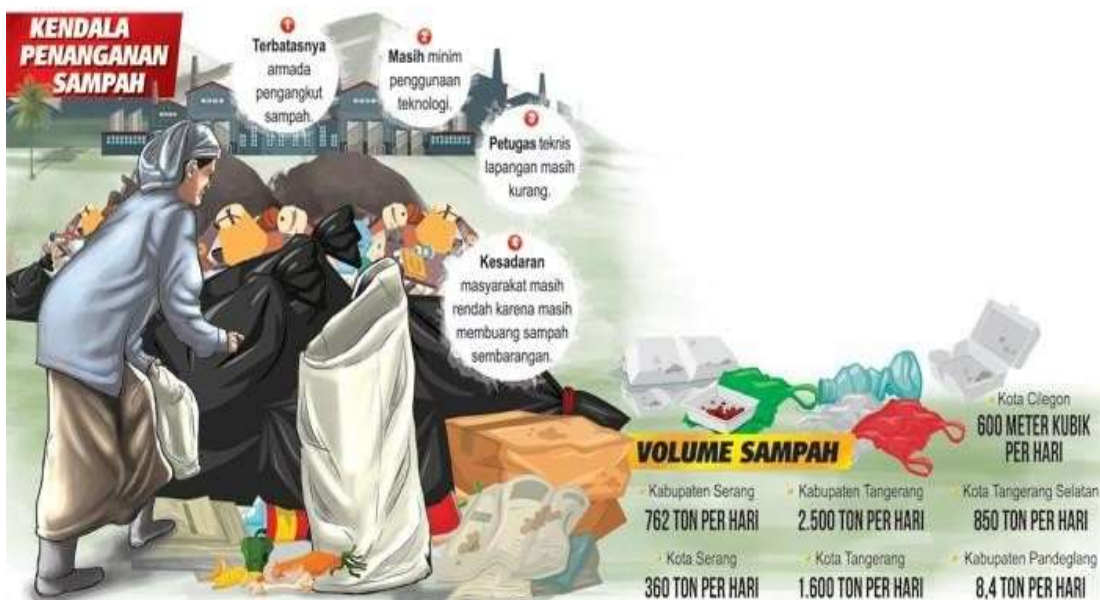
GAMBAR 1.3 VOLUME SAMPAH BANTEN

Sampah atau limbah rumah tangga adalah sampah yang berasal dari kegiatan sehari-hari di rumah tangga yang tidak termasuk tinjau dan tidak termasuk sampah spesifik, sampah merupakan hasil dari benda-benda yang sudah tidak terpakai yang berpotensi menjadi sisa material buangan, sisa material tersebut dapat berupa zat cair, padat, maupun gas yang nantinya akan dibuang ke alam. Sisa material sampah tersebut dapat menjadi pencemaran lingkungan. Sampah juga diatur oleh undang-undang No 18 tahun 2008 tentang pengelolaan sampah yang merupakan sisa kegiatan sehari-hari manusia atau proses alam yang berbentuk padat atau semi-padat berupa zat organik atau anorganik yang bersifat dapat terurai atau tidak dapat terurai yang sudah tidak dianggap lagi dan akan dibuang ke lingkungan.