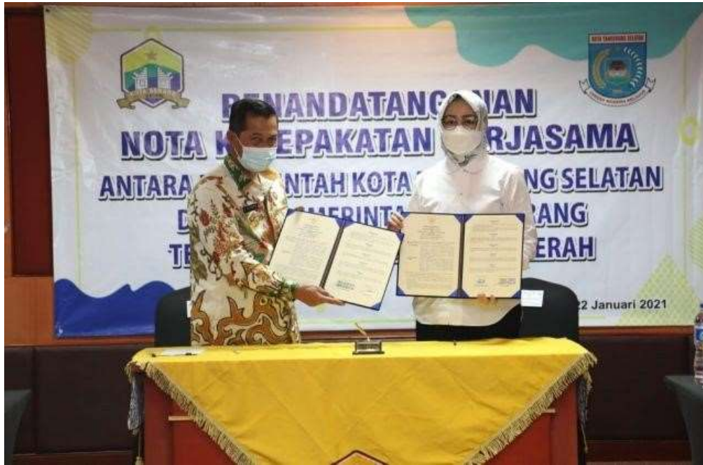
GAMBAR 1.1 TANDA TANGAN MOU KERJASAMA PEMKOT SERANGPEMKOT TANGSEL