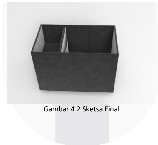
Gambar 4.2 Sketsa Final