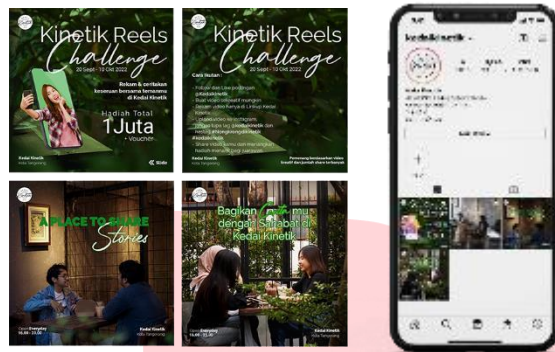
Gambar 7 Instagram Feeds