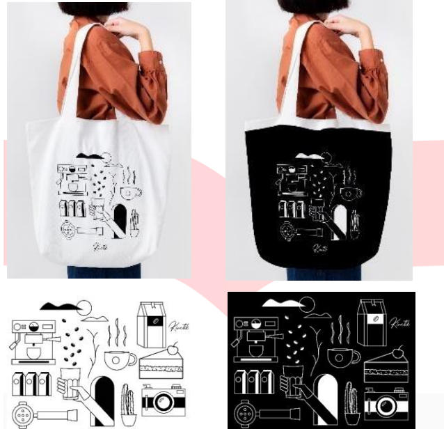
Sumber: Rahmaan, 2022 Gambar 9 Merchandise

Merchandise akan dibagikan kepada peserta lomba dan juga dijual kepada konsumen untuk setiap pembelian minimal 80 Ribu akan mendapatkan totebag gratis.