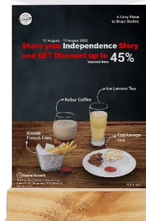
Gambar 10 Stand Table