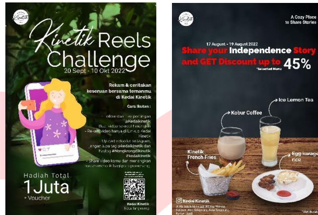
Gambar 5 Poster Interest

menciptakan awareness dari target audiens yang melihatnya dan membuat mereka tertarik untuk datang ke Kedai Kinetik. Poster ini akan disebar di tempat yang ramai seperti halte, alun-alun kota Tangerang, dan di tempat keramaian lainnya.