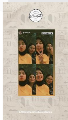
Gambar 8 Template Instastory