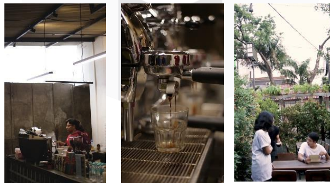
Gambar 6 Video Promotion