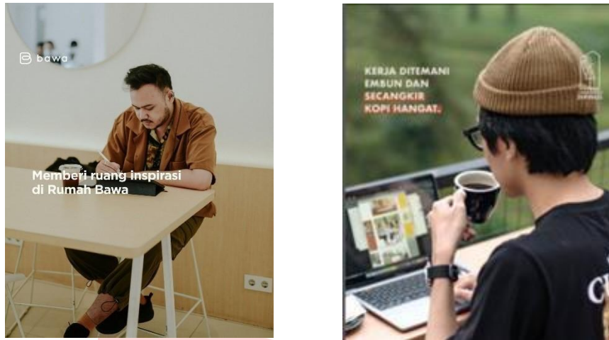
Gambar 3 Refrensi Gaya Visual

Gaya visual yang digunakan yaitu minimalis dan modern dengan visual fotografi. Gaya visual ini umumnya digunakan untuk postingan café karena lebih menarik dan memberikan kesan simple dan bersih.