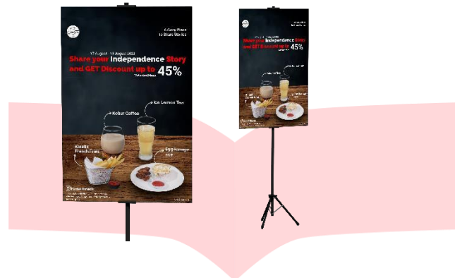
Gambar 11 Stand Banner