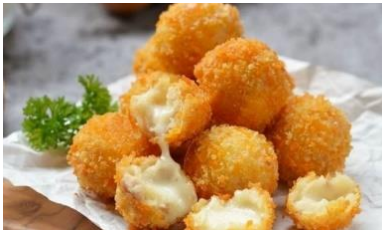
GAMBAR 6 Bitterballen