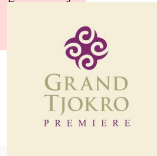
GAMBAR 2 Logo Grand Tjokro Hotel Bandung