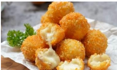
GAMBAR 6 Bitterballen