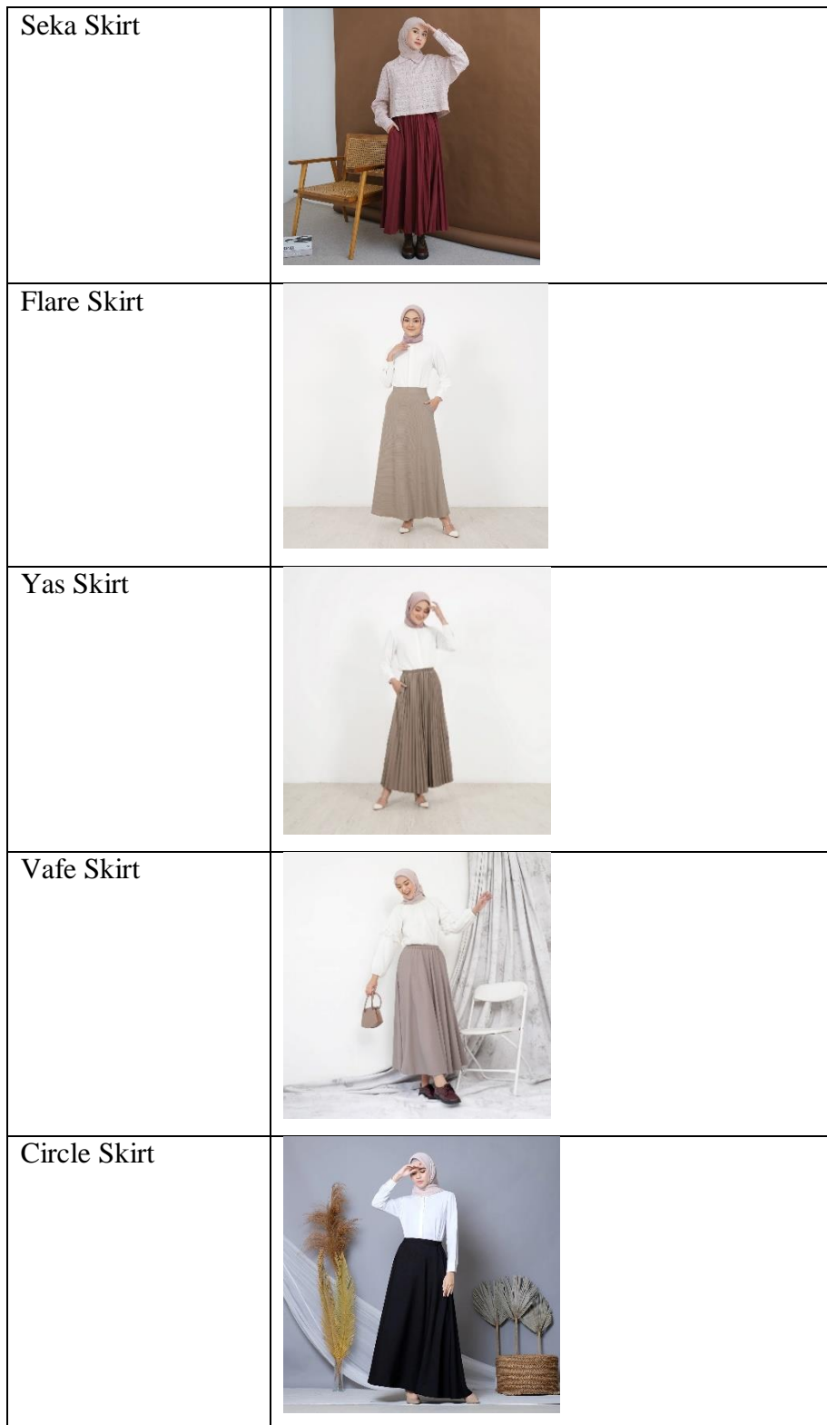
Tabel 1. 1 Produk A-Line