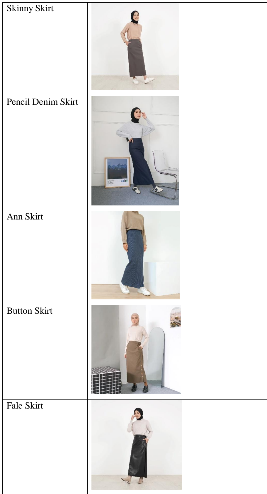
Tabel 1. 2 Produk H-Line