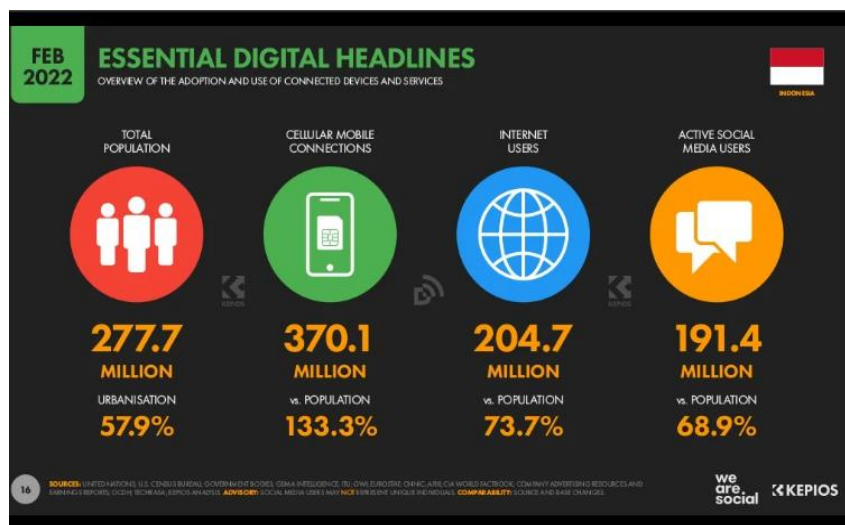
Gambar 1. 3 Laporan Terbaru Penggunaan Internet Tahun 2022