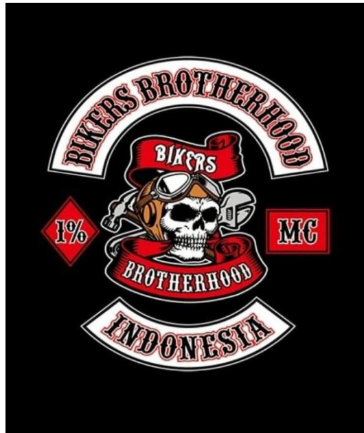
Gambar 1.2 Logo Bikers Brotherhood

Komunitas motor ini juga selalu mengadakan kegiatan bakti sosial berupa pembangunan masjid, penanaman pohon, pelestarian alan, kepedulian alam, tujuan dari kegiatan ini adalah untuk menyadarkan masyarakat akan pentingnya ekosistem.