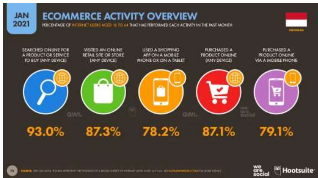
Gambar 1.3 Data Aktivitas E-Commerce Januari 2021

Dengan kepopuleran media sosial Instagram saat ini banyak orang yang melihat peluang baik untuk menjalankan bisnis melalui media sosial Instagram. Selain berfungsi untuk berkomunikasi dan menyebarkan informasi, pengguna Instagram saat ini sudah mulai menjalankan bisnisnya dengan mengunggah produk yang dijualnya melalui Instagram feeds maupun Instagram story . Dimana pada saat ini masyarakat sudah mulai melakukan segala kegiatannya secara online baik melakukan pekerjaan, berkomunikasi hingga untuk membeli kebutuhan sehari-hari saat ini semua sudah mulai melakukannya secara online .