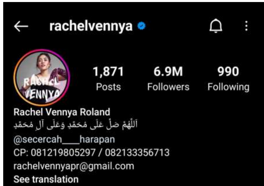
Gambar 1.5 Akun Instagram Rachel Venny