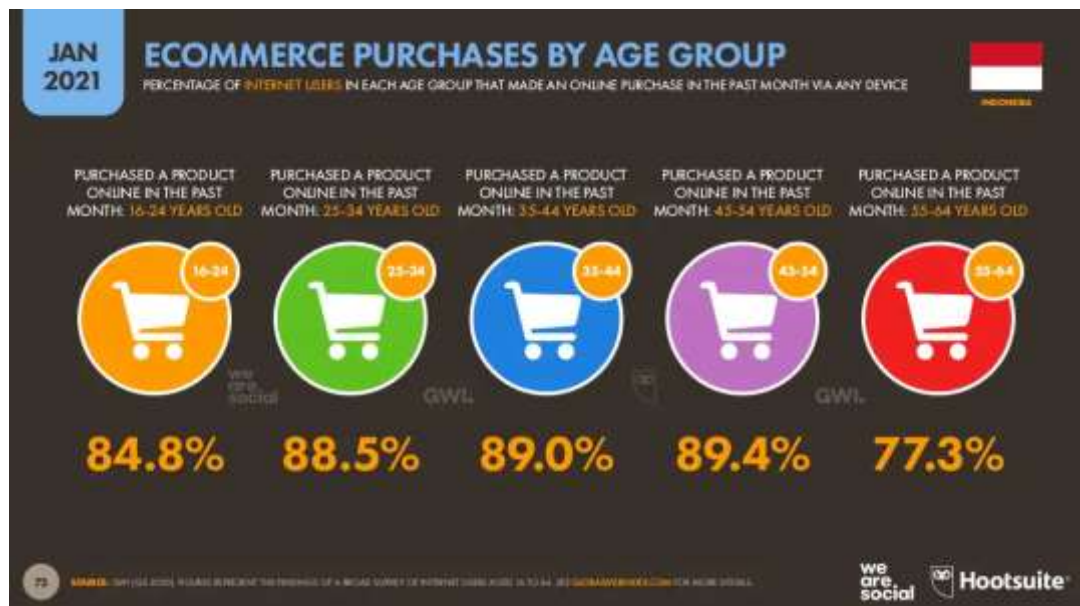
Gambar 1.4 Data Rentang Usia Berbelanja Online di E-Commerce Januari 2021

Masyarakat biasanya akan melihat review dari testimoni produk-produk yang sedang mereka butuhkan sebelum membeli produk tersebut, terkadang juga mereka akan melihat apa yang digunakan oleh selebritis atau selebgram yang mereka suka dan melihat review yang dilakukan oleh selebgram tersebut karena masyarakat akan lebih percaya dengan review yang dilakukan oleh selebgram favourite mereka.