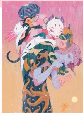
Gambar 1 Piggyback II, karya James Jean (2021)

James Jean adalah seniman kontemporer asal Taipei, Taiwan. Dalam karyanya, James Jean melukiskan tentang pendekatan antara imajinatif dengan elemen-elemen seperti elemen seni tradisional Tiongkok dan Jepang, karakter yang berbentuk anime atau buku komik kedalam satu komposisi yang kompleks. Karya-karyanya juga menggabungkan dunia kosmologis dan kontemporer, dan berfokus pada pengalaman individu dan universalnya.