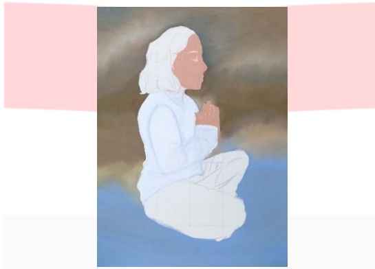
Gambar 16 Proses pengerjaan kanvas 3