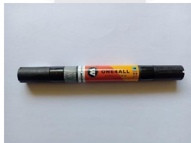
Gambar 8 Spidol akrilik