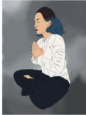
Gambar 9 Sketsa karya 1