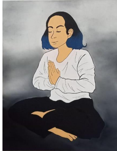
Gambar 20 Kanvas 2, "The Meditation II" (2022)