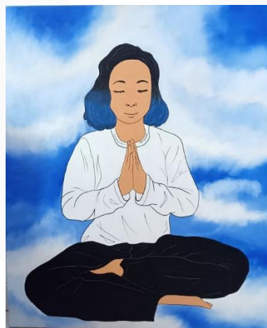
Gambar 23 Kanvas 5, "The Meditation V" (2022)

Karya ini menampilkan warna-warna yang terkesan kontras seperti warna merah, jingga, dan ungu. Warna merah melambangkan tekanan, warna jingga melambangkan kebahagiaan, dan warna ungu melambangkan kekuatan. Pada fase ini gejala dari kecemasan berlebih sudah lebih mudah dikendalikan.