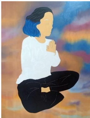
Gambar 17 Proses pengerjaan kanvas 4