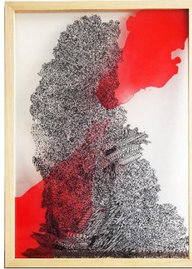
Gambar 2 Cloudburst #1, karya Rega Ayundya Putri (2020)