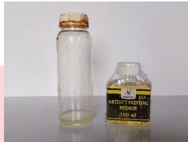
Gambar 6 Minyak