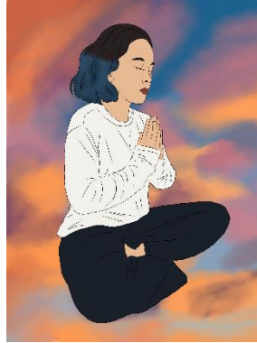
Gambar 12 Sketsa karya 4