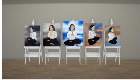
Gambar 22 Kanvas 4, "The Meditation IV" (2022)