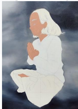
Gambar 14 Proses pengerjaan kanvas 1