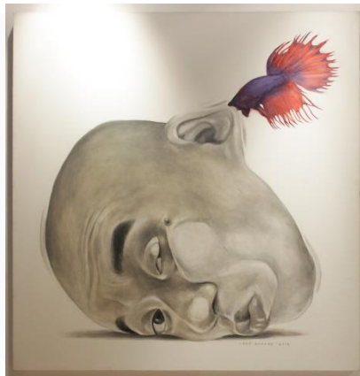
Gambar 3 The Calling, karya Agus Suwage (2004)

Agus adalah seniman asal Indonesia yang terkenal akan karyanya yang memakai portrait dirinya, juga terdapat elemen-elemen lain yang Agus Suwage tambahkan. Dalam pembuatan karyanya, Suwage menggunakan kamera untuk memotret mimik wajah dan posesnya dan menjadikannya sebagai karya seni.