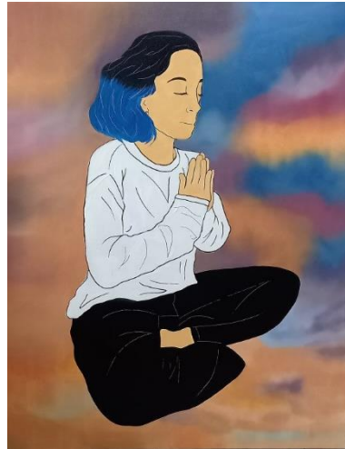
Gambar 22 Kanvas 4, "The Meditation IV" (2022)