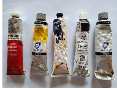
Gambar 5 Cat minyak