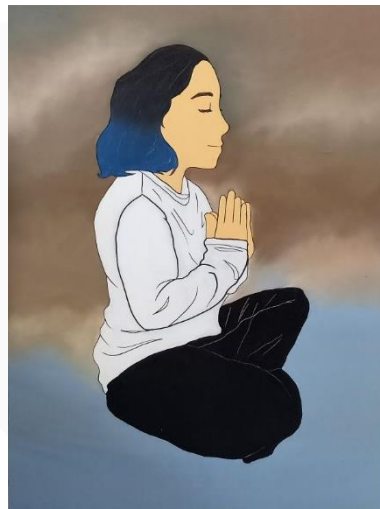
Gambar 21 Kanvas 3, "The Meditation III" (2022)

Menceritakan tentang apa yang terjadi saat penulis berada di fase kecemasan dan berusaha untuk menekannya dengan cara melakukan meditasi. Aura yang tadinya pekat berubah menjadi warna lebih cerah.