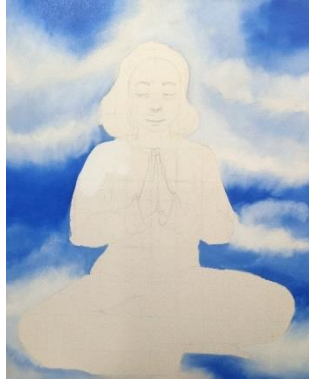
Gambar 18 Proses pengerjaan kanvas 5