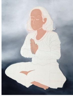
Gambar 15 Proses pengerjaan kanvas 2