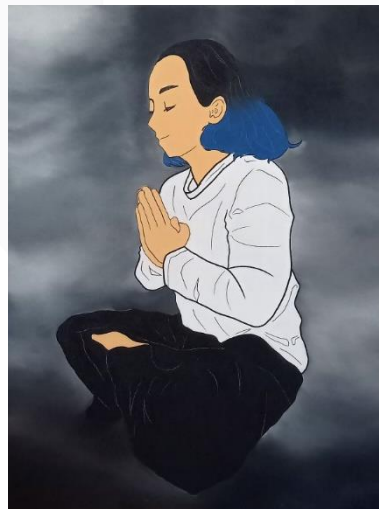
Gambar 19 Kanvas 1, "The Meditation 1" (2022)