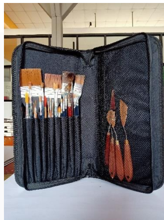
Gambar 7 Pisau palet dan kuas