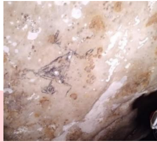
Gambar 3. Lukisan Manusia Purba, Leang Sampeang, Kab. Maros, Sulawesi Selatan

Dengan penemuan artefak Mesir Kuno tersebut, penulis menduga kuat bahwa karya self-portrait bahkan telah muncul jauh sebelumnya itu yakni lukisan zaman pra sejarah. Hal ini bisa dibuktikan dengan penemuan lukisan-lukisan manusia purba pada Leang (Gua) Sampeang di Kabupaten Maros dan pada Leang Sassang di Kabupaten Pangkep. Keduanya berada di Sulawesi Selatan.