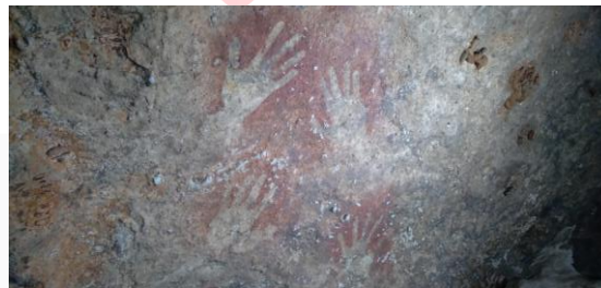
Gambar 4. Lukisan tapak tangan manusia purba, Leang Sassang, Kab. Pangkep, Prov. Sulawesi Selatan