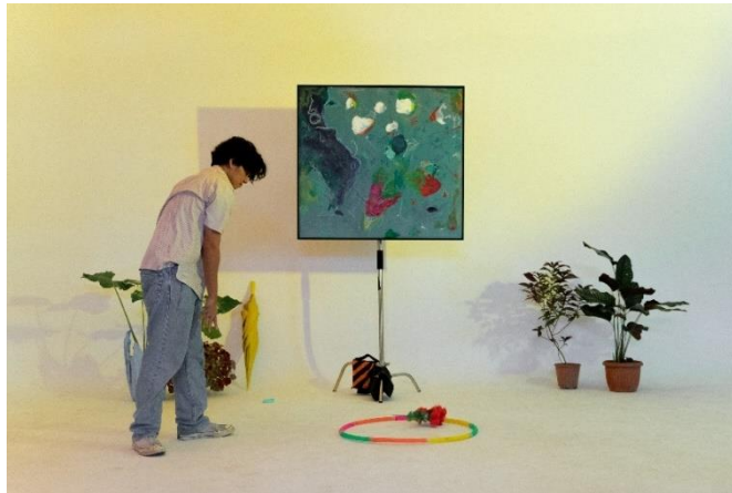
Gambar 7. "A Walk in The Park"

Karya lukisan berjudul "A walk in the park" merupakan visualisasi dari potret diri penulis khususnya pada sisi anima . Anima merupakan personalitas atau sifat feminin pada diri seorang pria. Sifat feminin pada diri penulis yang ingin ditampilkan pada karya "A walk in the park" yaitu, romantis, periang, lucu, serta sedih. Sebab keempat kata tersebut merupakan sifat yang tidak memiliki wujud atau objek nyata, penulis mencoba menggambarkannya dengan membayangkan sebuah peristiwa atau kejadian yaitu, kegiatan berjalan-jalan di taman. Mengingat masa kecil sering diajak berjalan dan berkegiatan di taman, penulis dan merasakan berbagai macam perasaan ketika berada di sekitaran taman seperti, dua orang pasangan yang sedang bercengkraman tangan sambil duduk di bangku taman, sekelompok anak kecil yang bermain dan bercanda, serta tangisan anak bayi. Dengan gaya lukis abstrak-ekspresionis penulis ingin menangkap esensi visual dari kegiatan berjalan di sebuah taman, penabrakan warna merah, biru, hijau menjadi dominan pada lukisan "A walk in the park", objek-objek seperti bunga mawar, pohon, rerumputan, langit, dan kaki yang berjalan dilukiskan secara samar-samar.