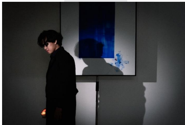
Gambar 8. "Cold-Blooded"