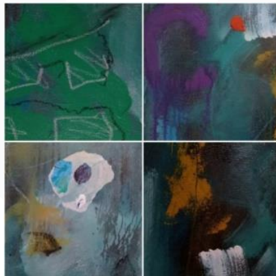
Gambar 6. Uji coba teknik

Penulis melakukan uji coba pada aspek teknis dalam proses berkarya. Penulis menerapkan prinsip atau unsur dasar rupa yang didapatkan pada perkuliahan semester awal pada mata kuliah gambar dasar (titik, garis, bentuk, ruang, warna, gelap-terang, dan ranah). Penerapan dasar-dasar rupa pada kanvas yang dilakukan penulis pada kanvas dengan menggunakan media campuran menghasilkan visual yang mengarah pada aliran abstrak-ekspresionis. Aliran abstrak-ekspresionis dipilih sebab sejarah panjangnya mengingatkan penulis mengenai alasan terahirnya gerakan aliran tersebut. Abstrak-ekspresionis terlahir atas keresahan seniman-seniman New York terhadap visual-visual seni yang dihasilkan pada saat itu, serta keinginan untuk menyaingi Paris sebagai pusat seni dunia. Keresahan yang sama dirasakan oleh penulis sebab seni rupa yang ditemukan di Makassar (domisili) masih sangat bersifat tradisi. Penulis menciptakan self-portrait dengan aliran abstrak ekspresionis untuk memperkaya pengalaman visual masyarakat Makassar.