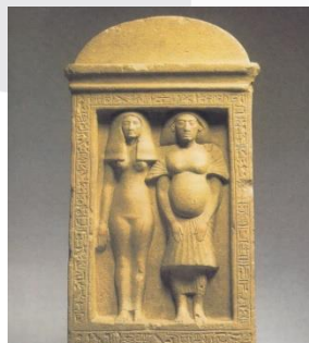
Gambar 2. Bak, self-portrait with his wife, Taheri

Namun, anggapan ini berubah sejalan dengan ditemukannya penemuan sejumlah artefak melalui penggalian ( excavation ) para arkeolog. Misalnya, artefak Mesir Kuno berupa patung self-portrait yang dibuat oleh seorang bak (pelayan) yang juga sekaligus sebagai pematung Raja Mesir. Artefak yang memperlihatkan sosok sang bak dan isterinya ini diyakini berumur lebih tua dari karya Van Eyck sebab artefak ini berasal dari masa Mesir Kuno (circa/sekitar tahun 1345 SM).