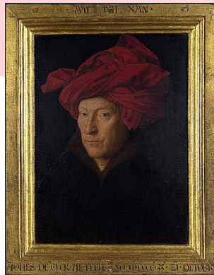
Gambar 1. Portrait of a Man in a Turban (Sumber: National Gallery, London)

Self-portrait merupakan salah satu cabang karya seni rupa dimana yang menjadi obyek utama adalah sosok sang seniman (pencipta) (Febriyanto, 2015). Karya self-portrait merupakan bentuk representasi diri seorang seniman dalam bentuk gambar ( drawings ), lukisan, fotografi, dan patung. Karya self-portrait yang dianggap muncul pertama kali menurut sejarah adalah " Portrait of a Man in a Turban " oleh Jan Van Eyck pada tahun 1433 (Campbell, 1988).