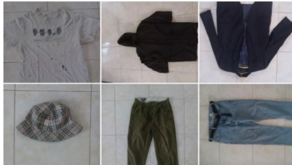
Gambar 5. Pakaian bekas